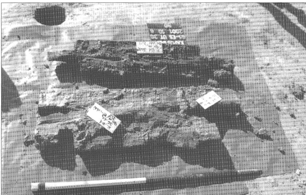
4. kép. Felszedett kútdeszkák