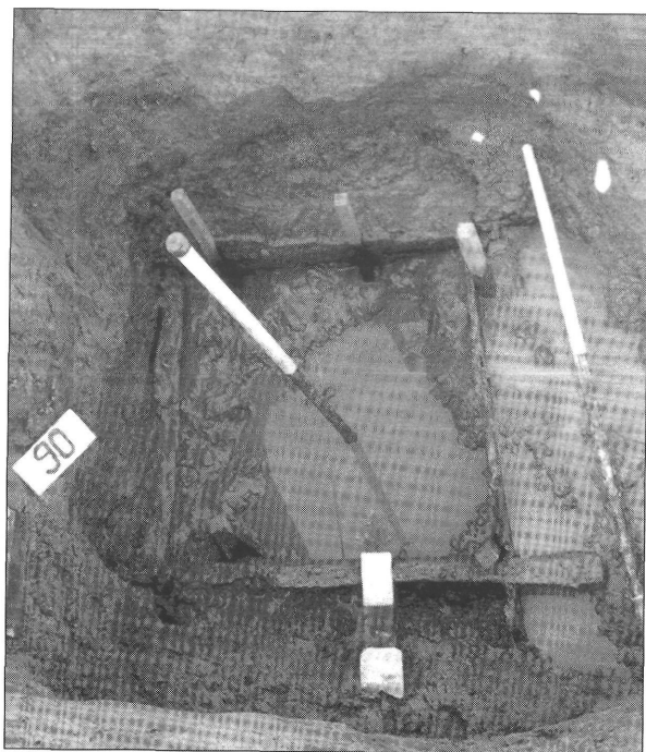
2. kép. A 90. sz. késő bronzkori kút. Jelentkezési szint.

Ásatásvezető: Somogyi Krisztina, Munkatársak: Gallina Zsolt, Molnár István régészek, Mészáros Szilvia, Szőke Gábor technikusok.