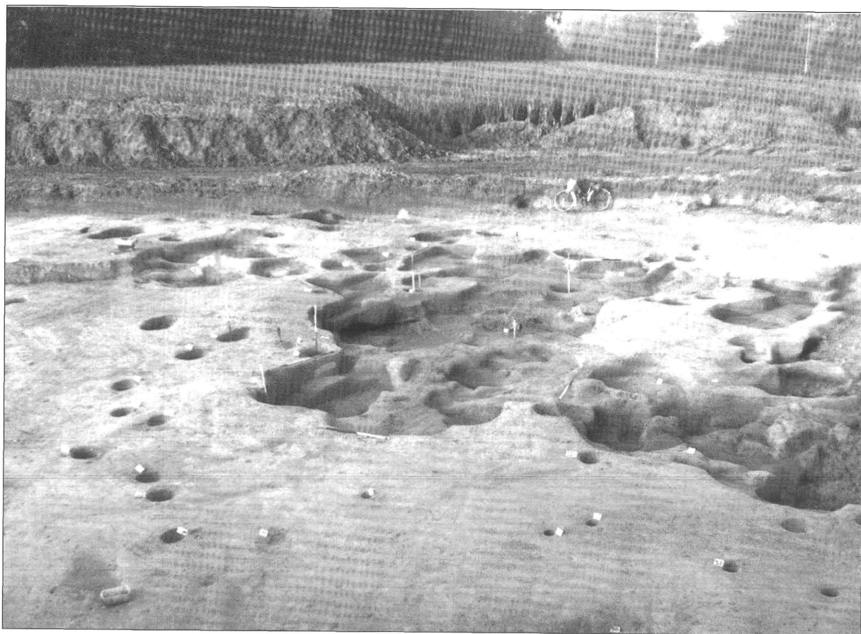
1. kép. A 10-64. sz. objektumcsoport a körülötte lévő cölöpökkel (részlet)

tileg sötétszürke, fényezett felületű perem is előfordult. A leletek közül még három, díszítetlen, illetve rovátkolt fejű tűt és egy spirális végű, lapított szárú, bronz karkát említhetünk meg.