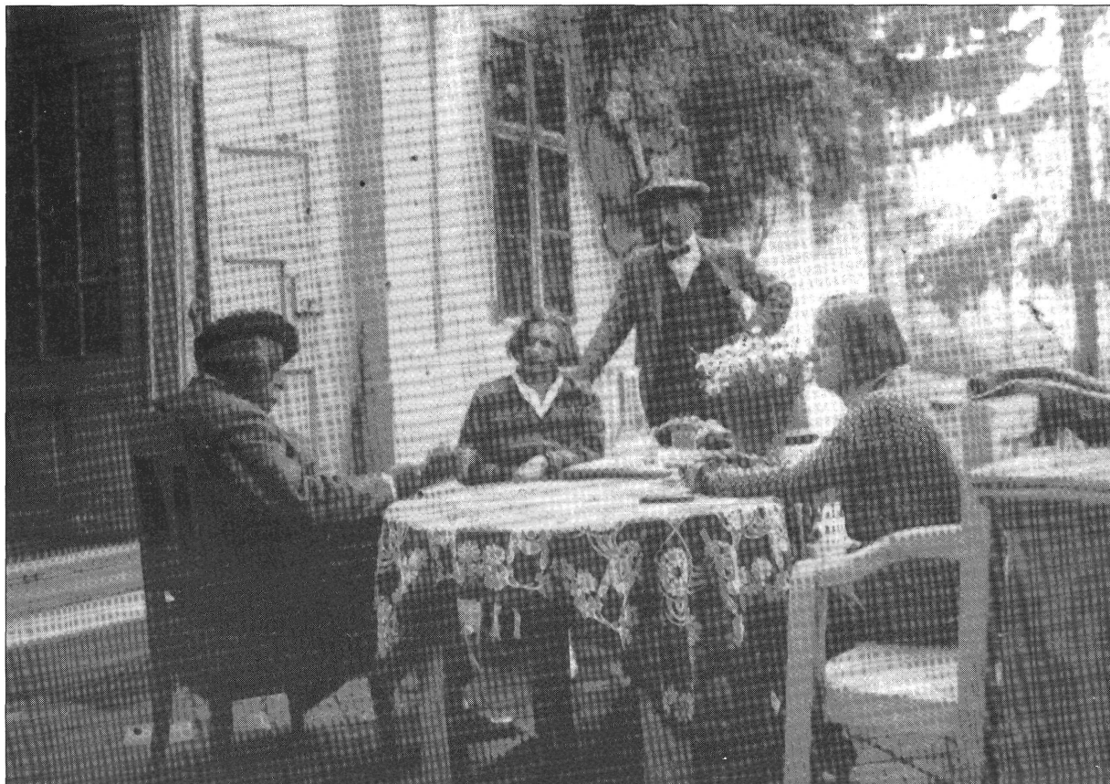
Rippl-Rónai József, felesége Lazarine, Dobossy Elek és Anella a Róma-villa mögötti teraszon. 1927. (Magyarország 1927. november 26.5.)

szanak a firmisz alatt. Ebben az ágyban fekszem én és mellettem az az asszony, akit igen szeretek aki fölállózza egész életét én értem. (Erről máskor többet)..."