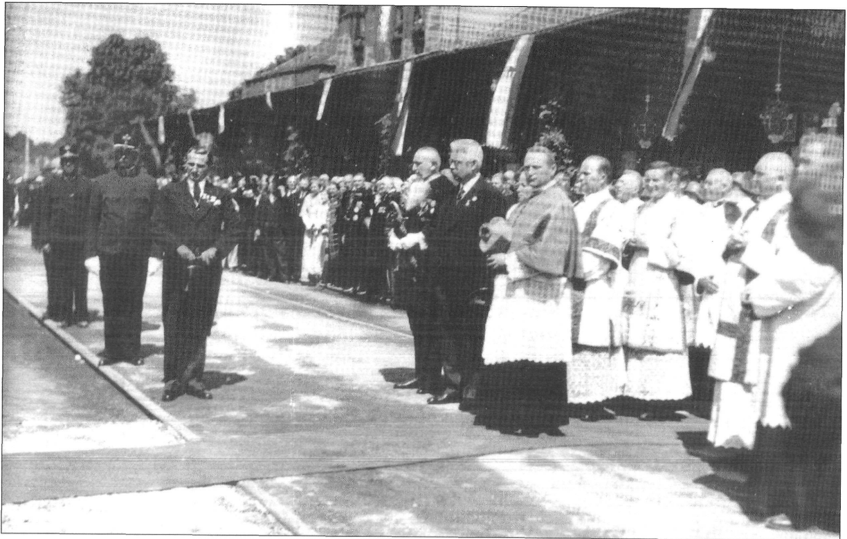
2. kép. Az Aranyvonat kaposvári fogadtatása