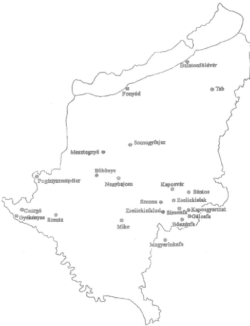
1. ábra. A megfigyelt növényfajok előfordulásai Somogy megyében.

A Zselicben a Bőszénfa-Simonfa feletti vonulat vízvázalasztó is. Két patak egymástól nem messze ered, de a vízvázalasztó vonulat ellenkező oldalán. Így Szenttamásnál (Bőszénfa) a Surján-patak délre, majd keletnek folyik. Széles völgytalp, valaha rétekek kísérvé. Rég itt haladt a Kaposvár-Szigetvár vasútvonal is. Ma az északi oldalon a Kaposvár-Bőszénfa közlekedési út kíséri. A Surján völgye a Zselic egyik legszebb részét tárja elénk. Elhalad Gálosfa-Hajmás-Kaposgyarmat-Cserénfa-Szentbalázs-Sántos faluk alatt és Taszár előtt éri el a Kapos vizét. A Zselic-patak Simonfánál (Cigány-forrásból ered) végigjön a széles, kies völgyön, mely a Zselic másik legszebb része. A Kaposvár-Szigetvár közlekedési út a patak felett magasan, a völgyek keleti oldalán, erdőkkel kísérvé, változatos hullámzással halad. A patak Zselicszentpál és Zselickislak alatt elfolyva eléri a várost és a termálfürdő után éri el a Kapos folyót. A Berki-patak a Ropolyi-erdő „Dugás-kút”-jából ered, majd végigjön a Ropolyi-völgy igen szép, változatos erdei közt. Aztán magához veszi a Szentmártoni-árok