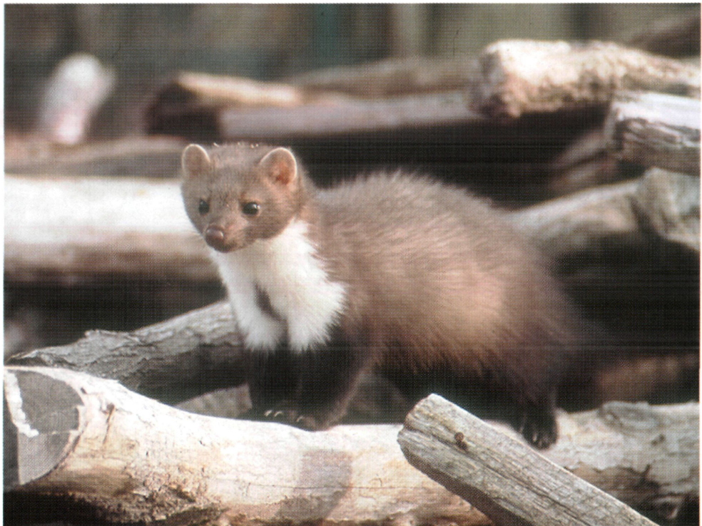
2. ábra: A nyest lakott területen gyakori