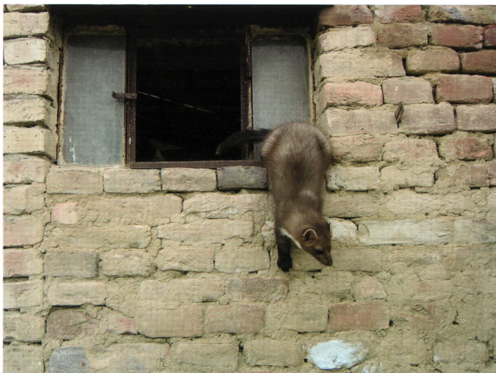
4. ábra: Istálló ablakból kimászó nyest