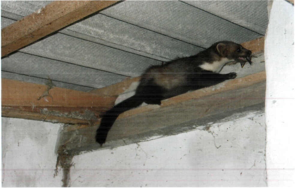
1. ábra: Nyest ( Martes foina ) verébfióka zsákmányával