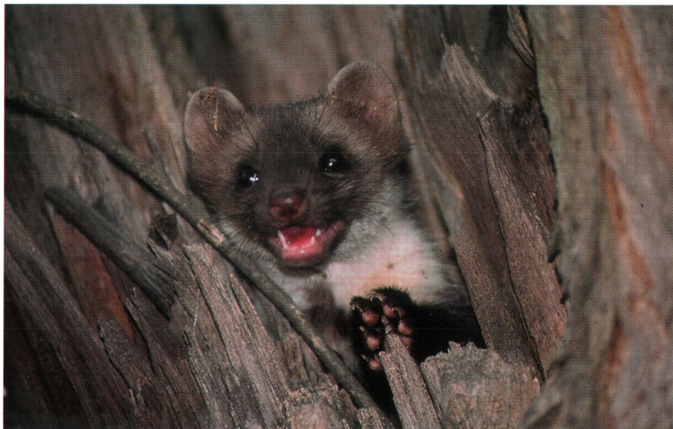
3. ábra: Kölyök nyest