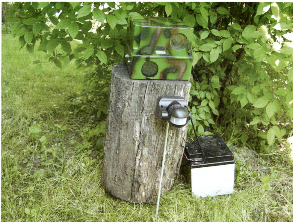
1. ábra: Automata kamera terepi vizsgálatokhoz