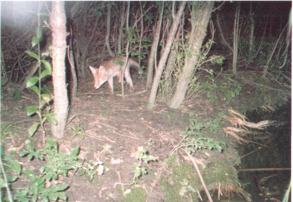
4. ábra: A egy kíváncsi rókát is megörökítet a gép