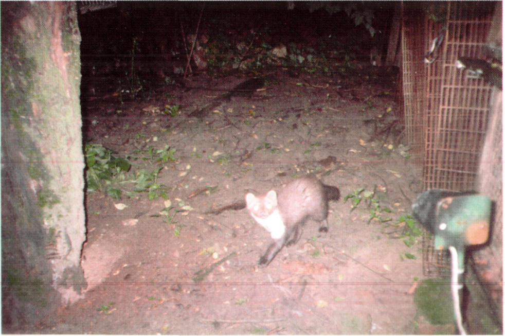
3. ábra: Az automata fényképezőgép udvarló nyestet örökített meg