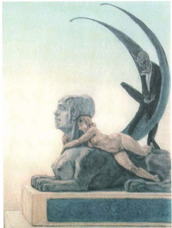
4. ábra: Félicien Rops: Címlap Jules Barbey d'Aurevilly Les d'aboliques című könyvéhez, 1879