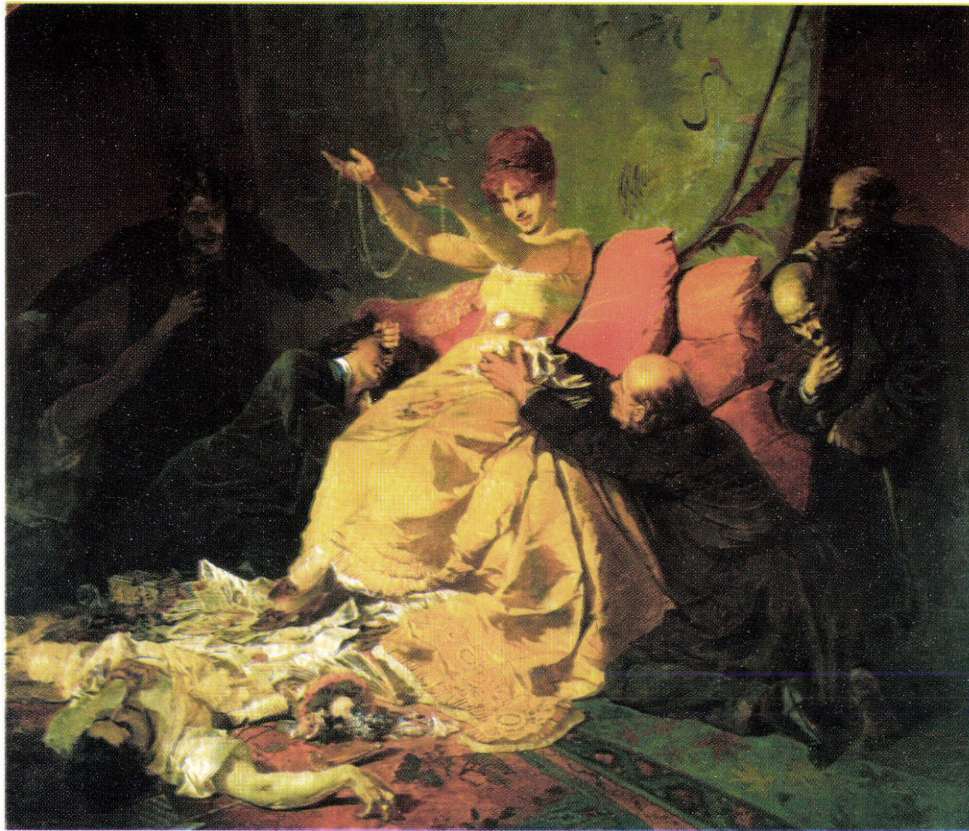
5. ábra: Zichy Mihály: Nana (A szirén éneke), 1880