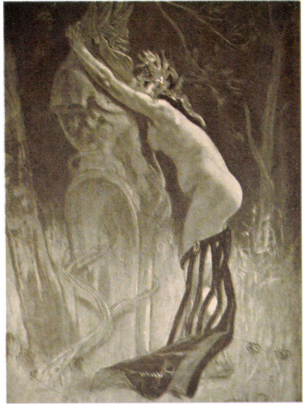
3. ábra: Félicien Rops: Előkészítő rajz Joséphin Péladan Curieuse című könyvéhez, 1886