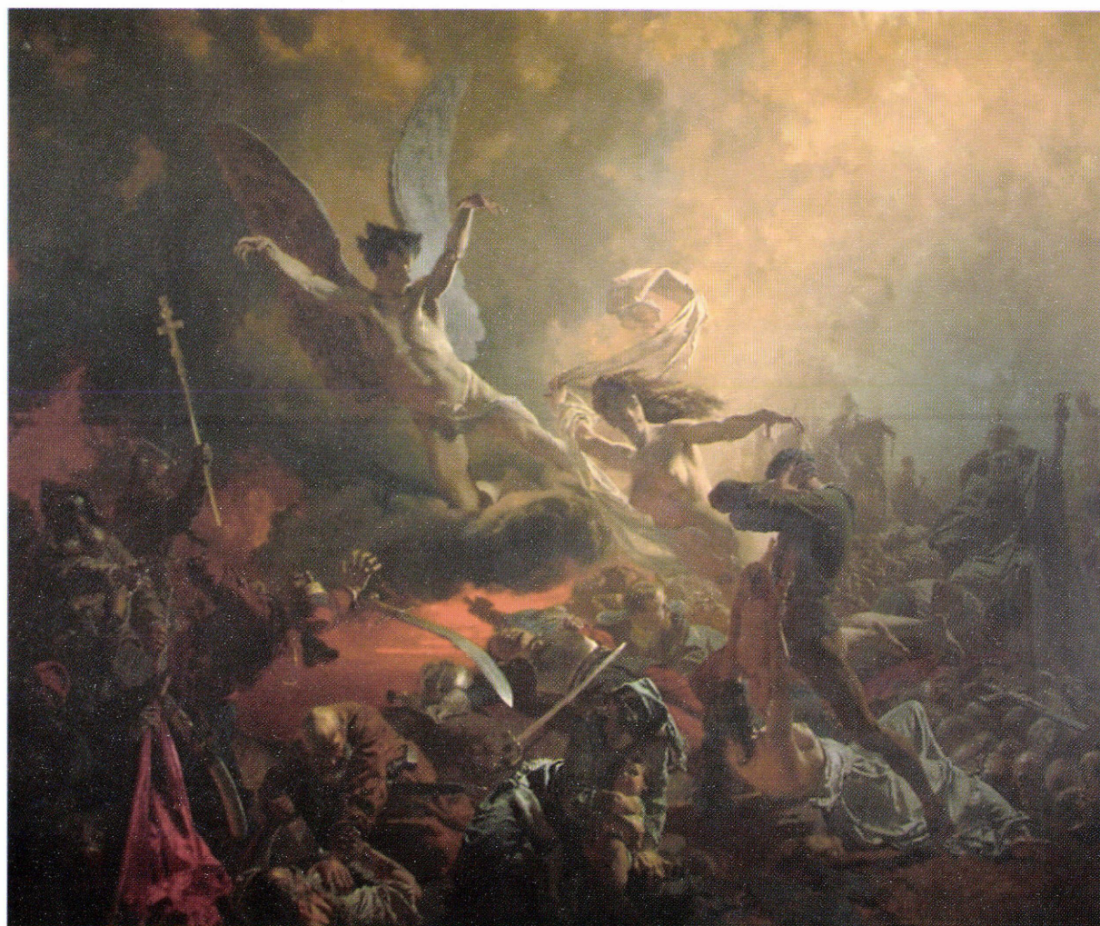
1. ábra: Zichy Mihály: A pusztítás génuszának diadala (A démon fegyverei), 1878