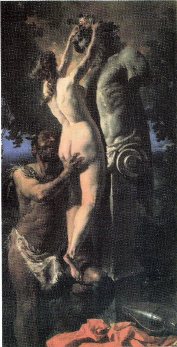
2. ábra: Zichy Mihály: Priaposz szobrának megkoszorúzása, 1875