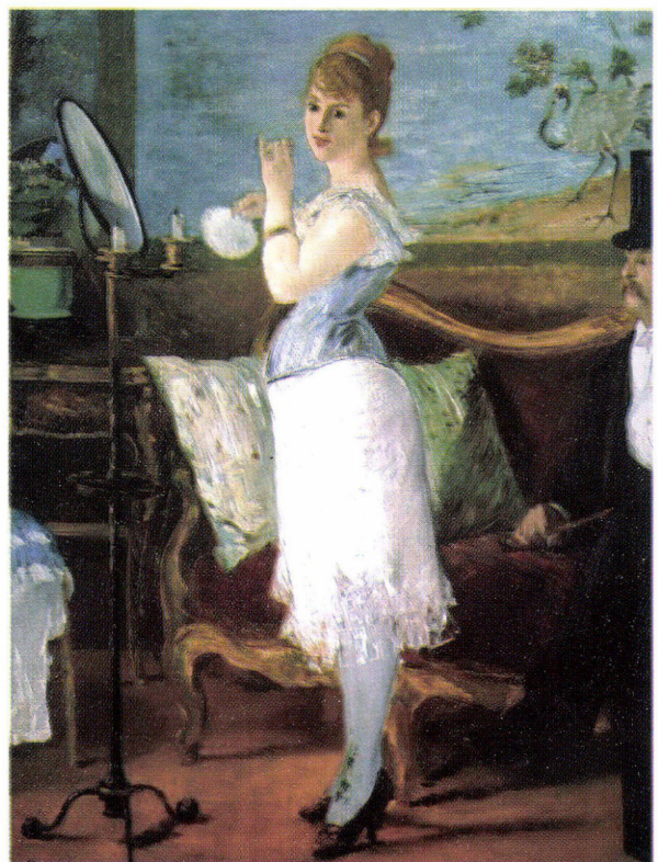
7. ábra: Édouard Manet: Nana, 1877