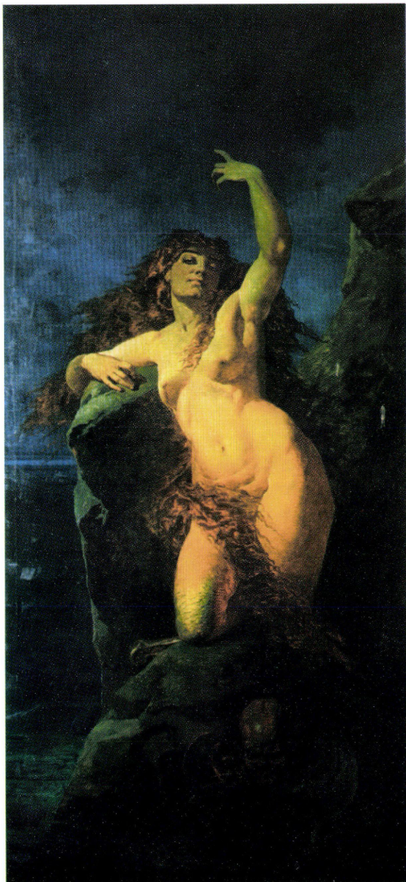
8. ábra: Zichy Mihály: Csábítás (A daloló szirén), 1881