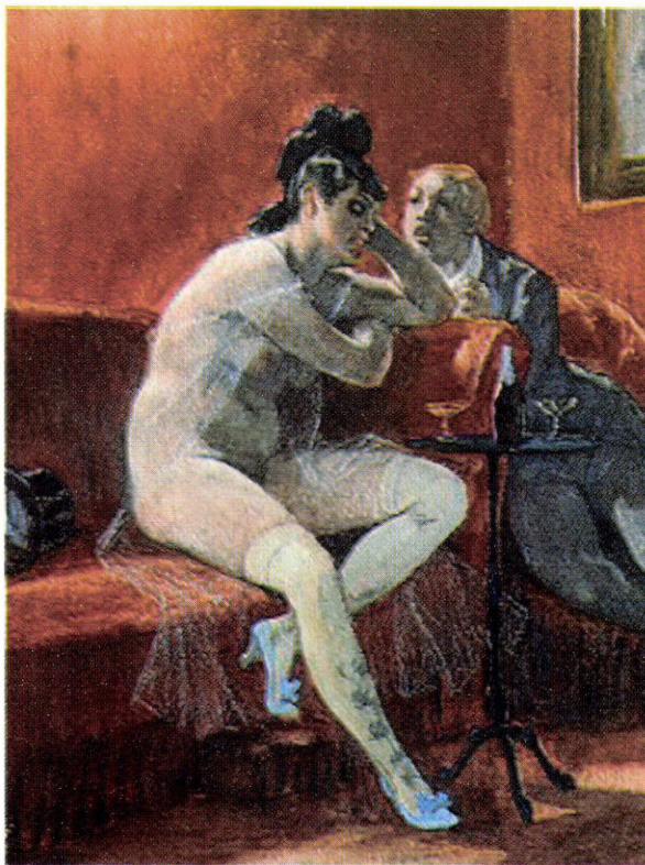
6. ábra: Félicien Rops: Chérubin éneke, 1878 és 1880