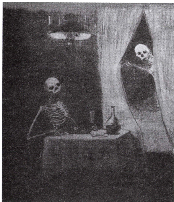
12. ábra: Odilon Redon: Két csontváz enteriőrben, 1882 körül