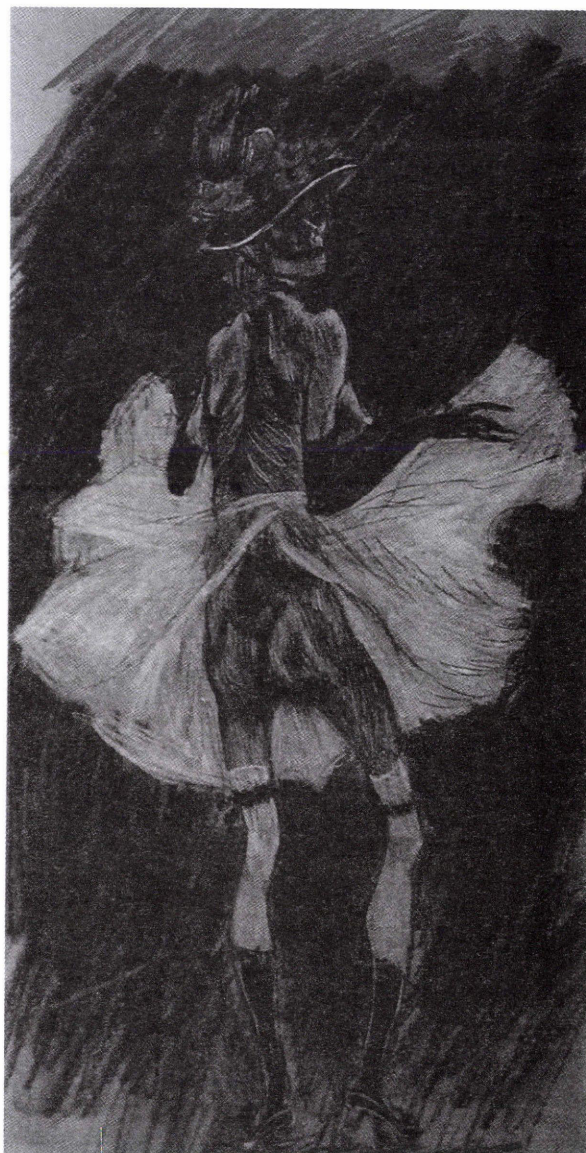
11. ábra: Félicien Rops: A táncoló halál, 1875