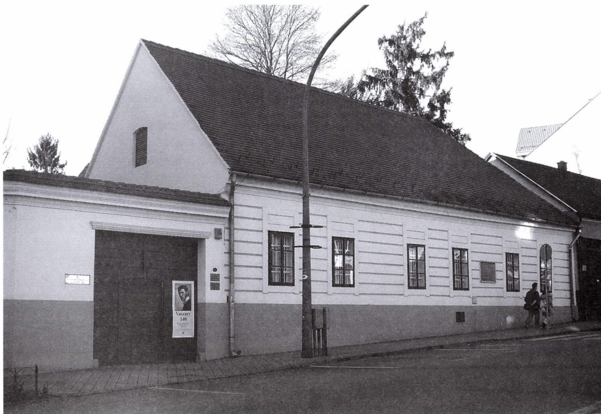
4. ábra: Vaszary János szülőháza Zárda utcában

valósággal elüldözött hazulról – és örültem, midőn másutt folytathattam a tanulmányaimat.” 31 Korán, 15 éves korában elkerült a szülővárosból, mert apja Kolozsvárra, az ottani piarista gimnáziumba küldte tanulni.