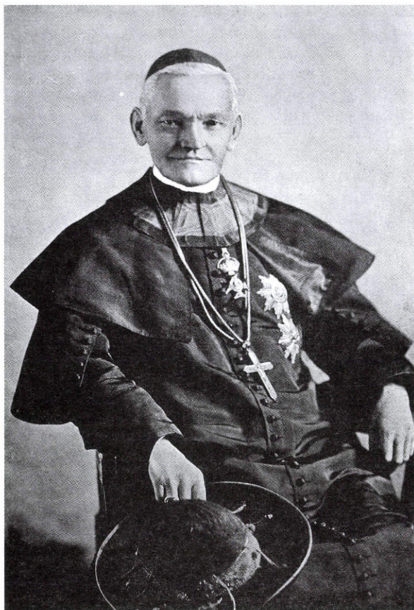
2. ábra: Vaszary Kolos hercegprímás

következő színhelye Esztergom, majd 1869-től 1885-ig Győrben volt rendházfőnök és a jezsuiták által alapított, később a bencések tulajdonába átment gimnázium igazgatója. Hírnevet szerzett közéleti tevékenységével és jótékonyágával. Támogatta a hozzá hasonlóan szegény sorsú gyermekeket és történelmi témájú tankönyveket írt az ifjúság számára. 15 Tanügyi eredményeinek elismeréseként a Ferenc József-rend lovagkeresztjé kitüntetésben részesítették.