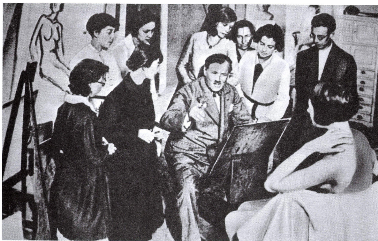
7. ábra: Vaszary tanítványai között