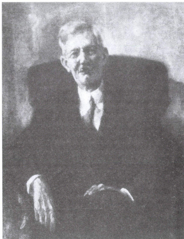
13. ábra: Udvary Pál Vaszary Gábor portréja

Vaszary Gábort – sok más művészhez hasonlóan – az emigrációt követően kizárták a magyar szellemi életből. Noha folyamatosan dolgozott, könyvei nem jelenhettek meg Magyarországon. Az emigrációban működő magyar kiadók (Kárpát, Pannónia, Amerikai Magyar Kiadó) több régi sikerkönyvét kiadták, míg újabb írásai nagyobb példányszámban németül és más nyelveken láttak napvilágot. A 80-as években még mindig aktív: a cleveland-i magyarok irodalmi, művészi és tudományos életének egyik fóruma, az Árpád Akadémia irodalmi fősztálya számára dolgozott. Tagja volt a PEN Club németországi tagozatának és bestsellereivel folyamatosan nemzetközi sikereket ért el. Munkásságának utolsó