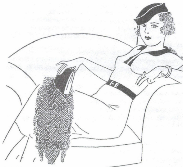
12. ábra: Vaszary Gábor illusztrációja az „Ő” c. regényéhez