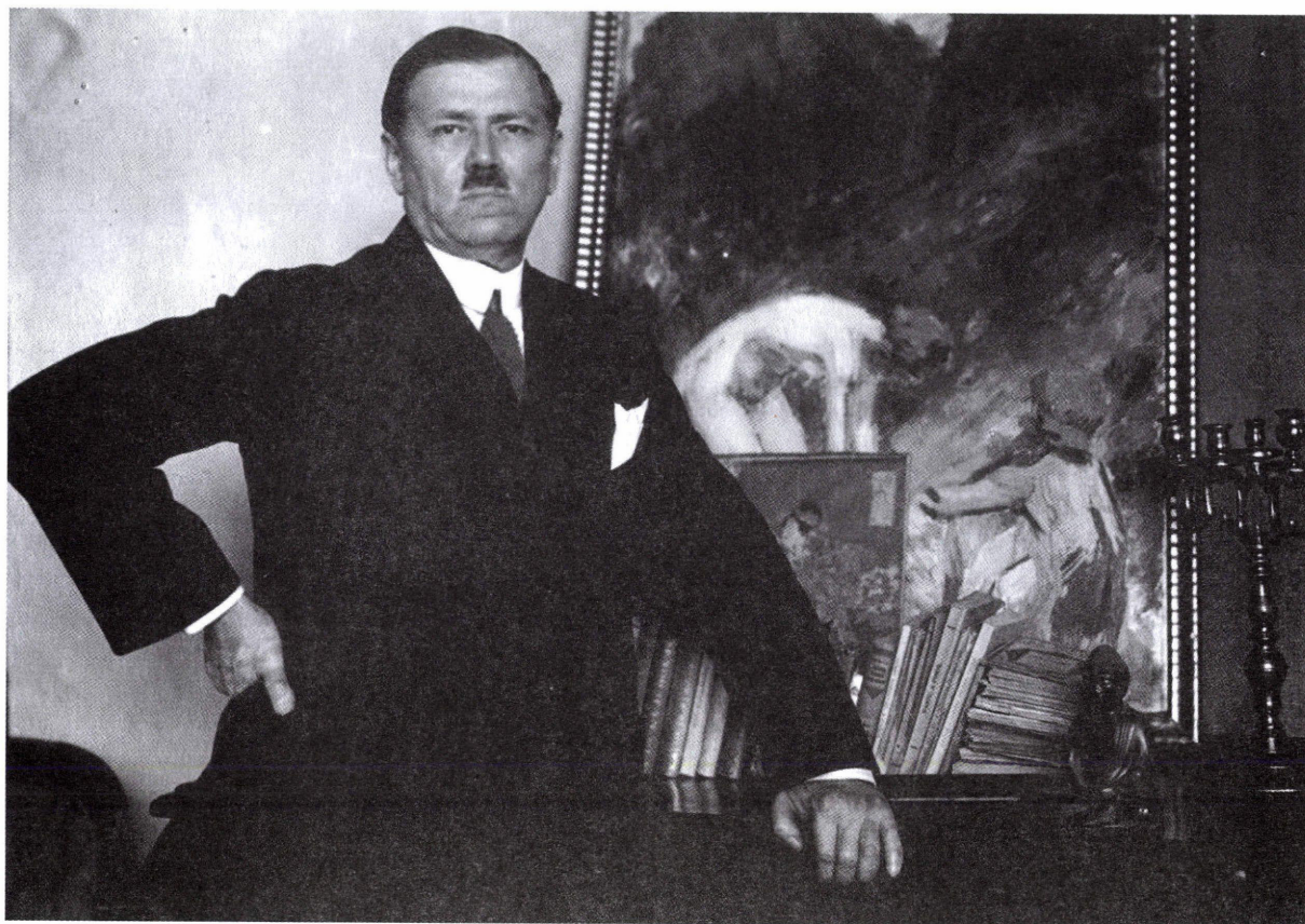
6. ábra: Vaszary János festőművész a műtermében