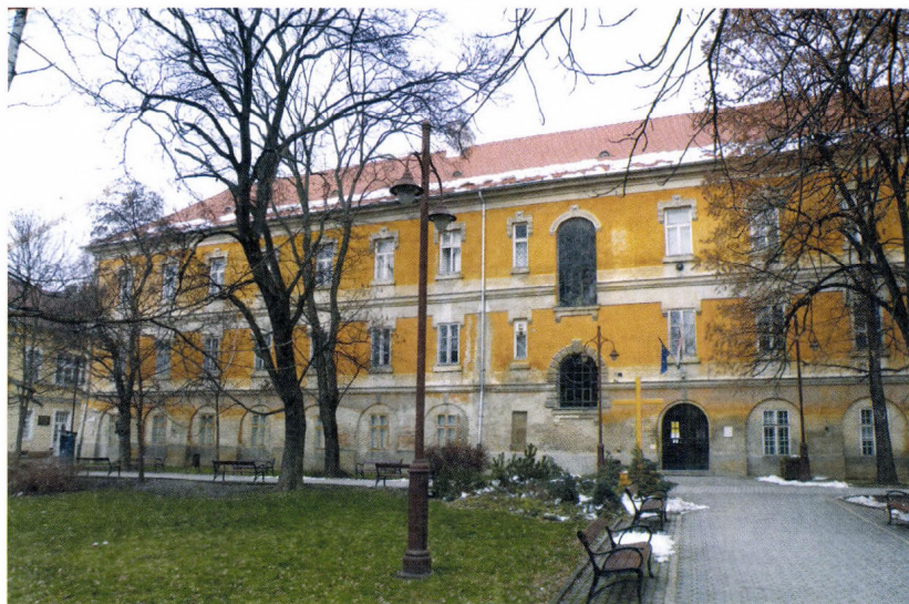
Kaposvár, Rippl-Rónai tér a múzeum egykori épületével, amely 1984-től a Somogy Megyei Levéltárnak ad otthont

A középkori gyűjtemények létrehozásában nagy szerepük volt az egyházi intézményeknek, kolostoroknak is. Ezek a felhalmozott értékek azonban csak a legszűkebb kör számára voltak elérhetőek. A már mai értelemmel is bíró, bár még mindig inkább a gyűjtőszeszvedély által vezérelt, uralkodói, főúri, egyházi gyűjtemények a reneszánsz múltkeresése során alakulnak ki. Ekkor kezdik gyűjteni mindazokat a tárgyakat, amelyek az ókori görög-római világgal teremtenek összeköttetést, és kiszélesítik azt a kört, amelyek ezekbe betekintést nyerhetnek. A gyűjteményeket feldogozzák, katalogizálják, leltározzák. Élén járt ezen a téren a Mátyás által 1470-ben építtetett palotában létrehozott könyvtár (Musarum sacellum) és tárház (kincstár), valamint a fegyvertár. Utána a hazai műgyűjtés a 18. században emelkedett újra európai szintűvé.