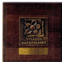
Kaposvár Város 2007-ben Virágos Kaposvárért díjat adományozott a Rippl-Rónai Emlékmúzeumnak