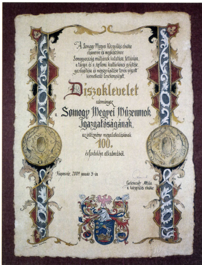
Somogy Megyei Közgyűlésének Elnöke a múzeum alapításának 100. évfordulóján díszoklevéllel emlékezett meg az intézmény alapításáról