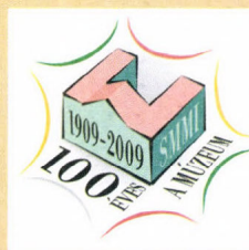
A múzeum emblémái a kezdetektől napjainkig, és a jubileumi logo