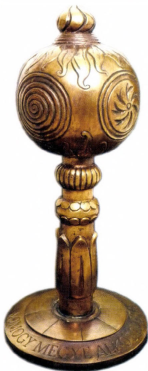
A tudományos és szakmai munkájának elismeréséül a Somogy Megyei Múzeumok Igazgatóságának kollektívája 1996-ban Somogy Megye Alkotói Díjat kapott