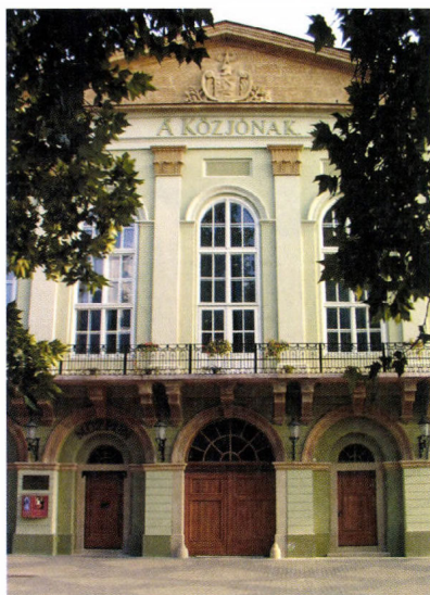
Az egykori Vármegyeháza épületében 1985-től a Somogy Megyei Múzeumok Igazgatósága található, az épületet 2000-ben részlegesen felújították.