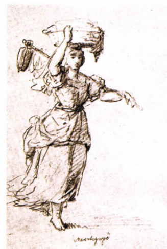
Női viselet Somogyban Ujházy Ferenc vázlatja az 1850-es évekből