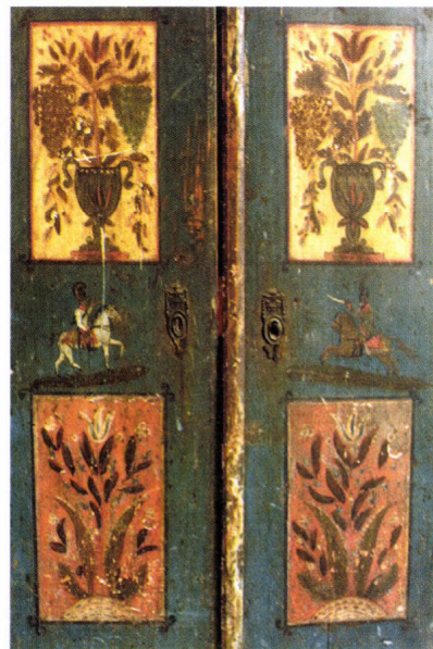
Kétajtós szekrény 1833-ból, Ecseny