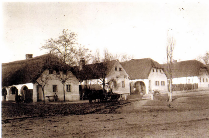
Szilárdfalú házak sora Szulokban, 1926