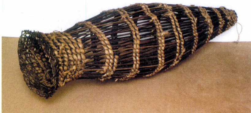
Haltartó, „röjtök”, Vörs