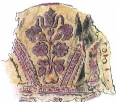
Posztómellény a 19. század végétől, Szenna. Gönczi Ferenc rajza a tárgy kartonjáról