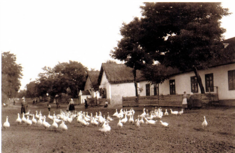
Libák kihajtása Törökkoppányban, 1927