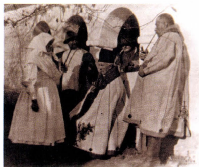
Idős asszony vászon öltözetben, a férfiak ujjas és kerek szűrben Kástélyosdombó, 1927

kellőleg körülírt tárgy mind a Gönczi Ferenc gyűjtése, aki életkorához képest szokatlan frissességgel, lelkesedéssel, minden fizetés vagy tiszteletdíj nélkül él a megérdemelt nyugalom helyett önként választott múzeumi hivatásának. ... A kaposvári múzeumra különös szerencse az is, hogy Gönczi Ferenc személyében nem dilettáns ambíciókat kamatoztat, ami nem mindig válik javára valamely közgyűjteménynek, hanem olyan hozzáértőt vallhat benne vezetőjének, aki a múzeum tárgyköreinek egyikében, a néprajzban elismert szakember, aki egész tanfelügyelői pályáján e hivatásával kongruens tudományterület érdemes munkása volt, s a kisebb-nagyobb tanulmányok, monográfiák egész sorával gazdagította néprajzi ismereteinket. Ezek után magától értetődő, hogy mindaz, amit e tárgykörben összegyűjtött, bizonyos vissza nem utasítható ajándékdarabtól eltekintve, muzeális érték, s amellet tekintélyes részében oly végső népi hagyatékek, amelynek mását, főleg más valakinek, még egyszer összegyűjteni aligha lenne lehetséges. A kaposvári néprajzi gyűjtemény oly része az összegyűjtött egyetemes magyar néprajzi tudományos kincsnek, amely nélkül idevonatkozó ismereteink hiányosak lennének. Gönczi Ferenc a gyűjtemények kétségbeejtő, krónikus elhelyezési nehézségei között gyűjtőmunkáját kénytelen volt a népélet és nevezetesen a népművészet, továbbá a szellemi hagyományok oly szűkebb körére korlátozni, amelyet az elhelyezhetőség szabott eléje..."