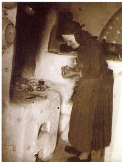
Hímestojást festő asszony Kaposzentbenedek, 1931