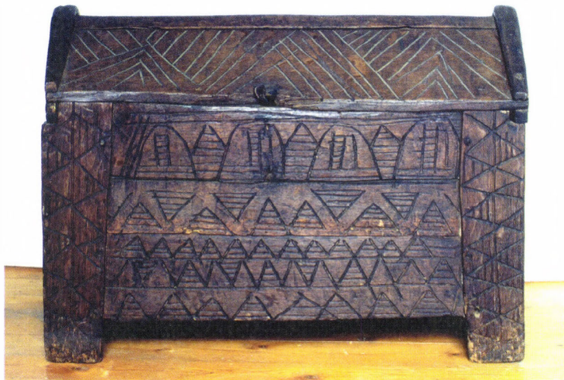
Ácsolt láda Paraszti munka a 19. század végétől, Tarany

Ezeken kívül, ha még valami van, mint a szoba tartozéka, azt is tessék hozzá venni. Jobban szeretném, ha ezeket pénzért lehetne megvenni. Ha nem, újat készíttetnének helyettük, ha valami nagyon sokba nem kerülnének. Ecseny és Bonnya úgy hiszem, ki tud szolgáltatni egy szobára való jellegzetes német bútort."