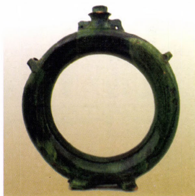
Perekulacs Kapolyból. Siklósi munka a 19. század közepéről

sürgős a néprajzi gyűjtés megkezdése. Ennek hatására 1914. február 28-án tartott közgyűlésen kimondták a néprajzi és népművészeti tárgyak gyűjtésének a megkezdését, melynek munkálataival az 1913. augusztus 4-én alelnökké választott Gönczi Ferencet bízták meg.