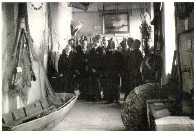
A néprajzi kiállítás részlete 1935-ben