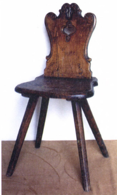
Támlásszék intarziás díszítéssel, 1798-as évszámmal, Osztopán