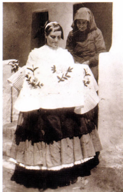
Indulás a keresztlőre Törökkoppány, 1927