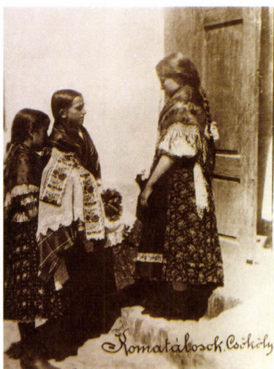
Komatálvivő kislányok Csökly, 1936