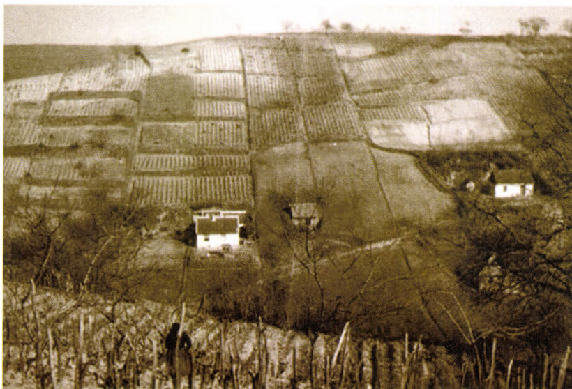
Szőlők a taszári Teleki-hegyen, 1951

Az állattenyésztés témakörében 1952-re „A parasztközösségek és az uradalmak pásztorai” témát tervezte felgyűjteni, de tovább szeretne volna folytatni megkezdett szőlészeti kutatásait is Külső-Somogy falvaiban. 1954-ben a „Települési munkacsoporthoz” kapcsolódva a Zselici településtípusok felderítésével, a „Halászati munkacsoportban” a drávi sebes vízi halászzattal gondolta behatóbban foglalkozni. Az 1950-es évek gyűjtemény gyarapításai (tárgy, fotó) az első témakörben végzett intenzív kutatásairól tanúskodnak.