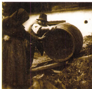
A hordót csöpögőre állítják Somogyjád, 1951