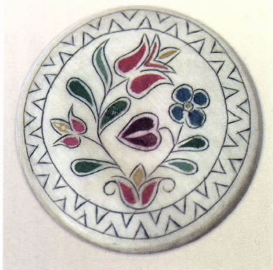
Bross, Varga László munkája