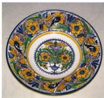
Habán díszítésű falitál. Falusi Béla fazekas, Népművészet Mestere munkája, 2006

Együd hagyaték néven: 190 db hangszalagot, 36 db magnókazettát, 154 db archív (Normál és Super 8-as) filmfelvételt, 4 db video kazettát őriz a múzeum.