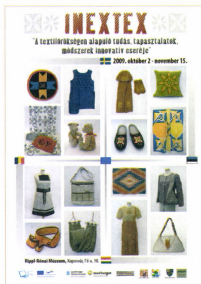
A INEXTEX kiállítás plakátja, 2009