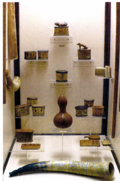
Pásztorélet, pásztorművészet. Részlet a Rippl-Rónai Múzeum állandó néprajzi kiállításából

Az 1990-es beszámolóban olvashatjuk az intézményvezető tollából: „Felülvizsgáltuk a főépületben kialakult épülethasznosítási koncepciót. Irodáink rovására növeltük a raktározási és kiállítási tereinket. 1991-ben a szakmai osztályok megkezdik egy állandó kiállítás előkészületeit.”