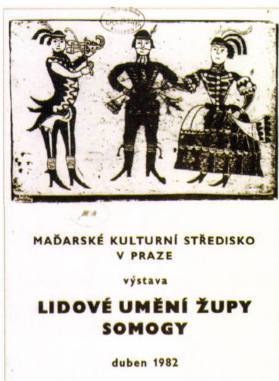
Somogy népművészete című kiállítás Prága, 1982