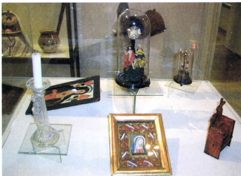
Részletek a Somogy megye népművészete című kiállításból, 2001