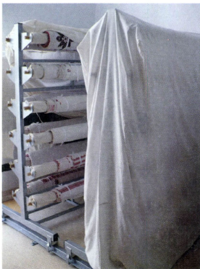
A textilraktár részlete, 2008