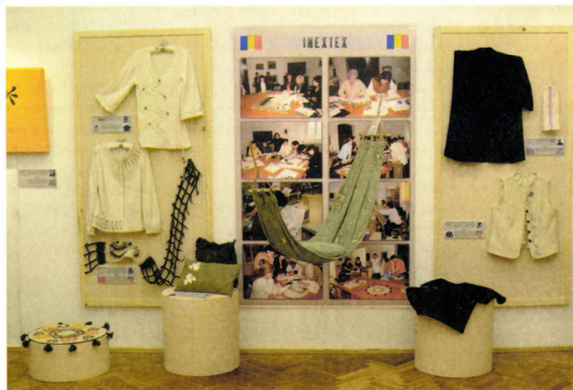
Részletek az INEXTEX kiállításból, 2009