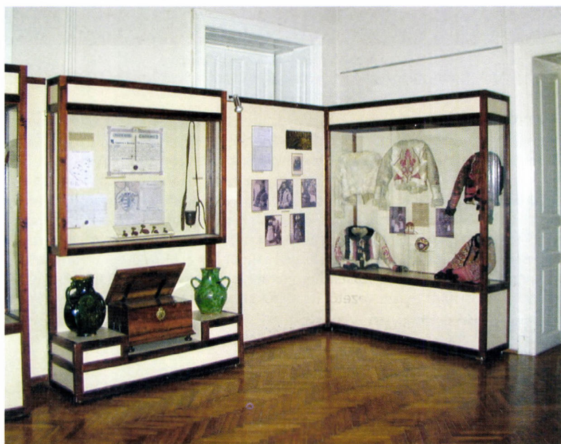
Fejezetek Somogy néprajzából. A Rippl-Rónai Múzeum állandó néprajzi kiállításának részlete