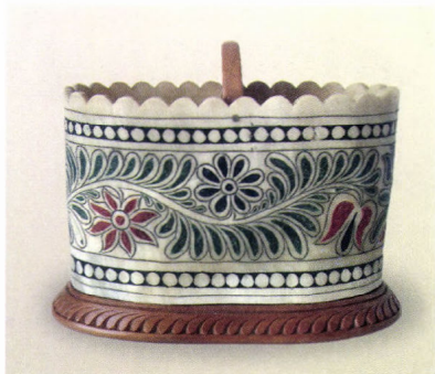
Cigarettakínáló, Jancsikity János munkája