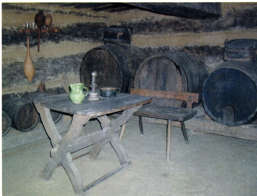
A zselickisfaludi pince részlete a Szabadtéri Néprajzi Gyűjteményben