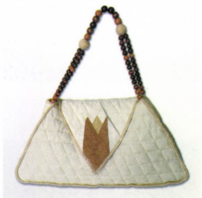
Új termék az inspirációs tárgy alapján. Lancsár Etelka kaposzderahelyi alkotó munkája, 2009

A Kortárs jelenségek gyűjteményének összetétele: 274 db tárgy, 379 tétel dokumentum, 370 tétel tanulmány és egyéb kiadvány.