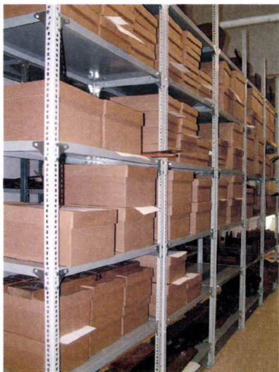
A néprajzi raktár részlete, 2008