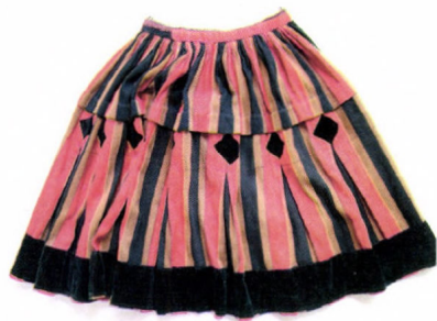
Szoknya Csikmadarasról (Csíki Székely Múzeum, 432) (inspirációs tárgy)