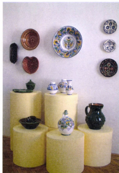
„A szépség kertjében”... Népművészet Mesterei a Dél-Dunántúlról című kiállítás részletei, 2006

2008–2009-ben az Oktatási és Kulturális Minisztérium, illetve a Somogy megyei Területi Horvát Kisebbségi Önkormányzat anyagi támogatásával megújult a lakócsai Horvát Nemzetiségi Tájház épülete és kiállítása.