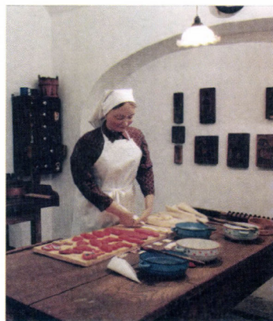
Mézeskalácsos és viaszöntő mester műhelye a „Mesterek és műhelyek” című kiállításban