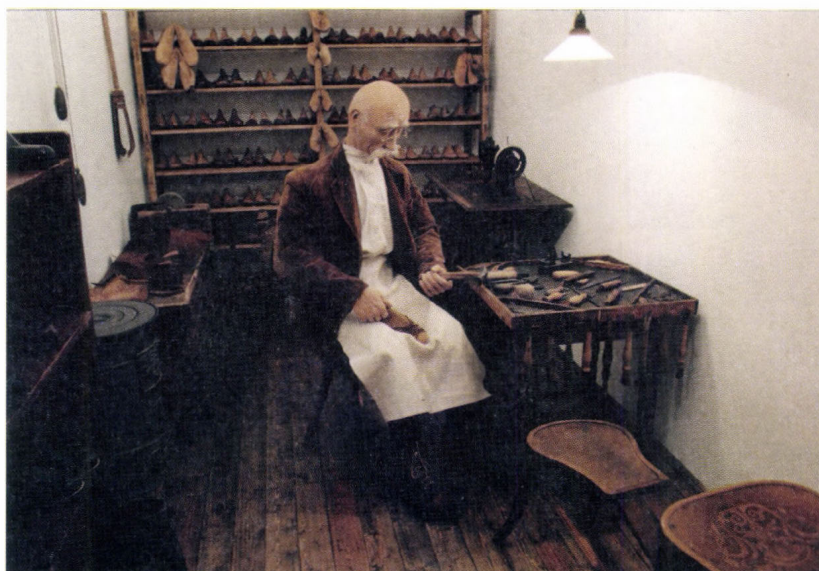
Cipésműhely a „Mesterek és műhelyek” című kiállításban