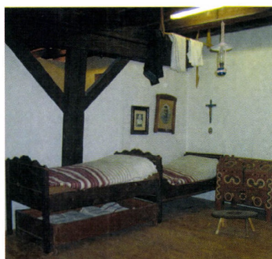
Részlet a Dráva Múzeum állandó néprajzi kiállításából

Ebben az időszakban a megye néprajzát feldolgozó kiadványok sora is megszakadt. Más intézmények kiadványaiban jelentek meg a szakemberek írásai, vagy csak egy-egy tanulmány, cikk látott napvilágot a megyei múzeum 1973-ban megindult periodikájában, a Somogyi Múzeumok Közleményeiben. A gyűjteményfejlesztés területén is kimutatható a korábbi lendület megtorpanása, ami lemérhető a leltárkönyvi bejegyzésekből.