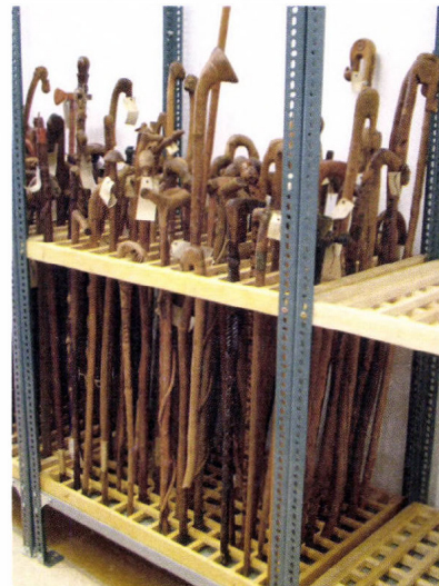
Pásztorbotok tárolása a néprajzi raktárban, 2008