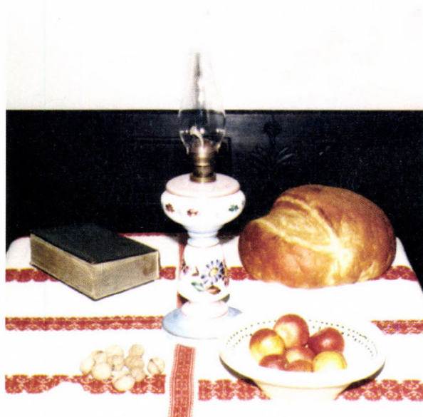
A katolikus hitélet tárgyai paraszti használatban című időszaki kiállítás, 1994