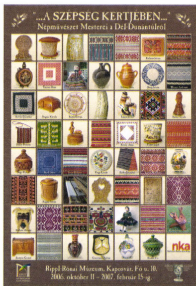
„A szépség kertjében” című kiállítás plakátja