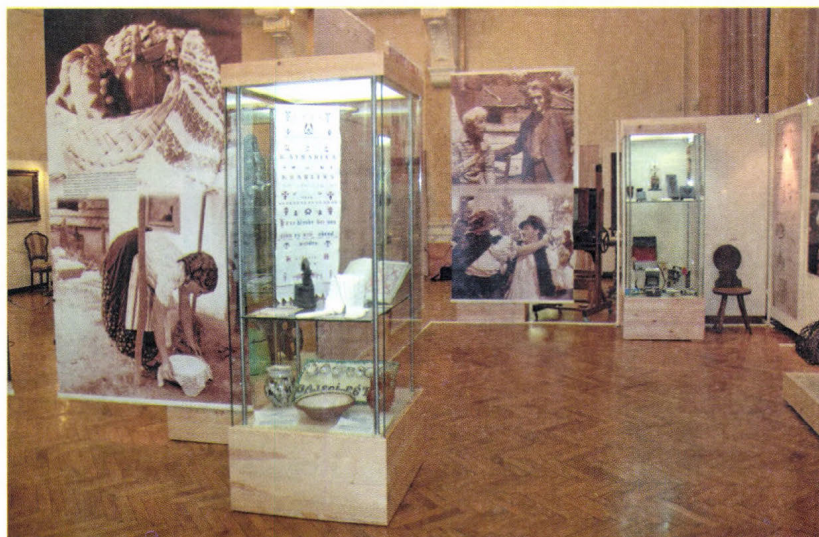
Részletek a Somogyország Öröksége – 100 éves a múzeum – című kiállítás néprajzi fejezetéből, 2009