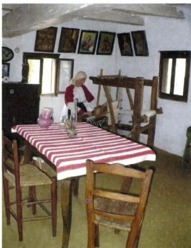
A Horvát Nemzetiségi Tájház felújított kiállításának részletei