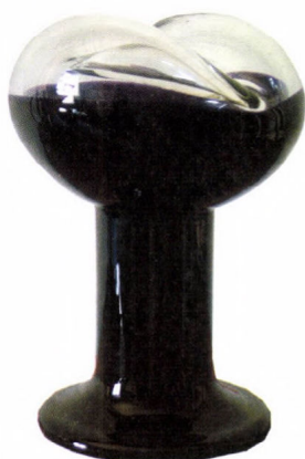
Kanyák Zsófia: Lichtobjekt Rosenthal Stúdió, 1972