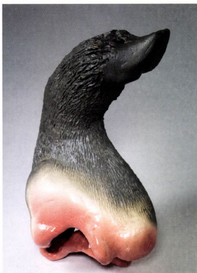
Szántó Tamás: Orrláb I. 2001