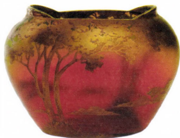
Szeccsiós üveg kaspó, 1900-as évek eleje