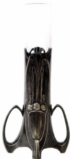
Szeccsessziós üvegváza, 1900-as évek eleje

Múzeumunkban található több darabos, intarziás ebédlőgarnitúrája (szekrény, vitrin, asztal és székek) azon bútortervei közül valók, melyekben a barokk stílus újjáélesztett hagyományait egy sajátos, magyaros formavilággal ötvözi. Az együttes az 1920-as években készülhetett, és Germanus Gyula hagyatékából származik.