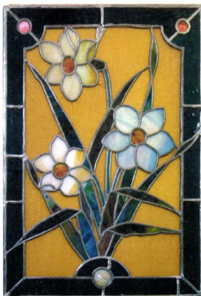
Róth Miksa: Üvegkép, 20. század eleje