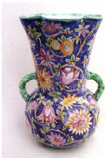
Goszthonyi Mária: Kétfüles váza, 1970-es évek után