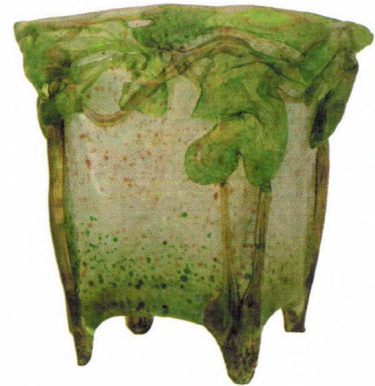
Smetana Ágnes üvegárgyái a bárdudvarnoki gyűjteményből