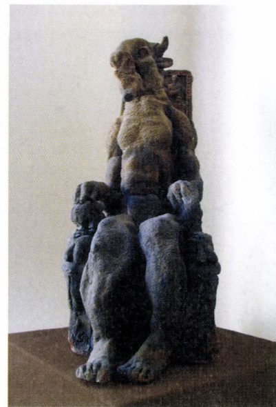
Schrammel Imre: Minotaurusz, 1988