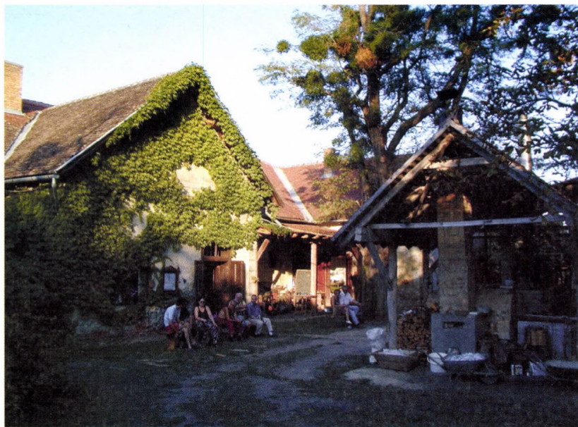
Bárdudvarnok, Goszthony Kúria és a Bárdudvarnoki Üvegművészeti Alkotótelep, 2004