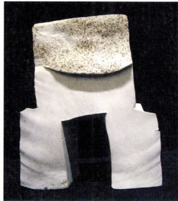
Kecskeméti Sándor: Porcelán plasztika, 2001

A legutóbbi, 2009-es év ajándékait a modern magyar üvegművészet klasszikusa, Kanyák Zsófia hagyatékából megszerzett funkcionális és díszüveg plasztikák jelzik, melyek a 70-es évek muránó és Rosenthal stúdióinak termékei voltak. Az üvegyűjtemény legújabb szerzeményei közé tartoznak Gáspár György üvegművész Aliens sorozatából két kiváló üvegplasztika Nemzeti Kulturális Alap pályázata segítségével. A művész 2006-ban kibontakozó Aliens üvegplasztikai sorozata egy önálló művészeti, plasztikai és technikai innováció egészét alkotja. A 2006-ban készült Mars Attack specifikusan az öntött részemlemek kemencében történő újra összeolvasztására épít. Ezzel a bonyolult és speciális folyamattal az összeépülő elemek megőrzik az eredeti geometrikus rajzolatukat. Az egymáshoz érő síkok a hőmérséklet emelkedésével folyamatosan torzulnak, a konstrukció ezzel az organikus kifejezés felé halad, olyan módon, hogy az eredeti szerkesztési elv mindvégig visszakövethe-