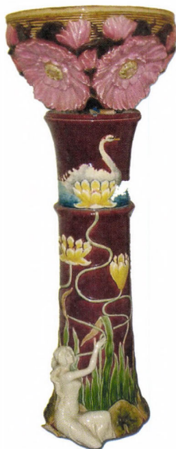
Zsolnay virágtartó, 1900-as évek eleje

A Rippl-Rónai Múzeum iparművészeti anyaga eredendően a Rippl-Rónai Villához, illetve a központi intézményhez kapcsolt kisebb emlékmúzeumok kísérelő berendezéseiből állt. Zichy Mihály zalai emlékmúzeumában egy 19. századi arisztokrata művész különleges, egzotikumot sem nélkülöző tárgydarabjai tekinthetők meg. A művész társadalmi státuszát, életkörülményeit reprezentáló tárgyanyagból kiemelkedő értékkel bírnak a bútorok, így az áttört faragású indiai garnitúra és a grúz szobát díszítő mozaikintarziás berendezés illetve a különleges fegyvergyűjtemény.