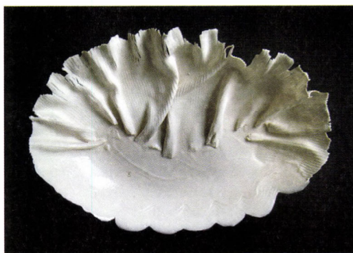
Borza Teréz: Porcelánplasztika, 2001