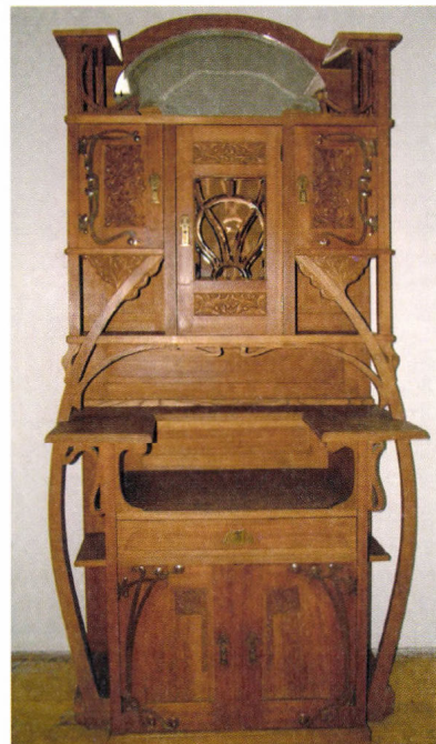
Szeccsiós ebédlőszekrény, 20. század eleje