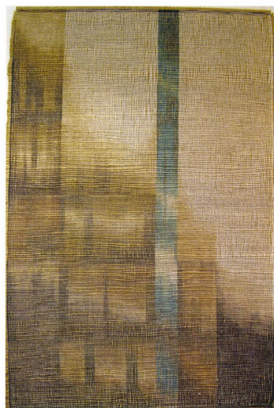
Szuppán Irén: Omlás, falikárpit, 1986