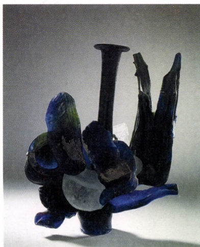
Bárdibükk üveg, 1990-es évek eleje