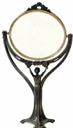
Szeccsessziós tükör, 1900-as évek eleje