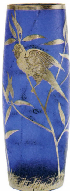
Szecessziós üvegváza konzerválás előtt és restaurált állapotban