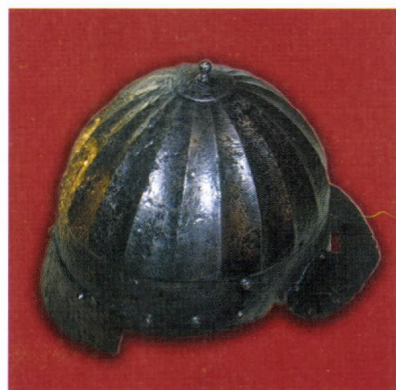
Középkori vas sisak restaurálás előtt és után