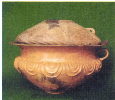
Későronzkori urna tisztítás előtt és restaurálva