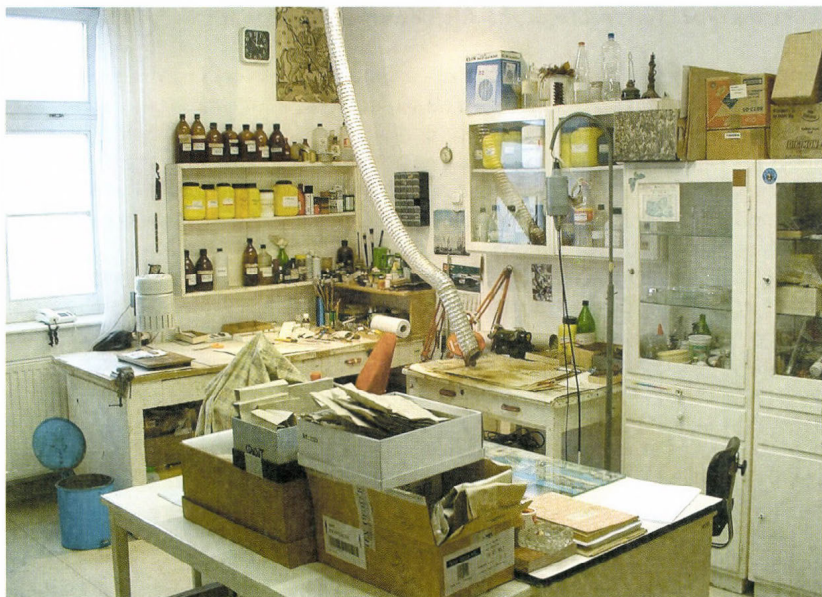
Fémrestaurátor műhely, 2004