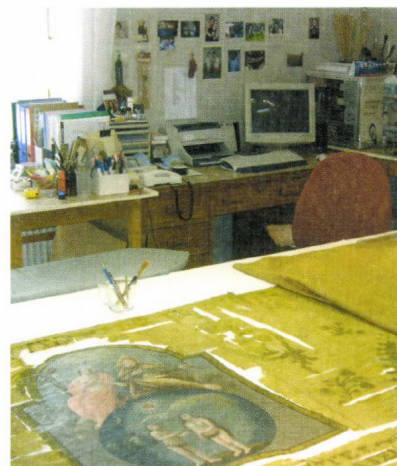
Textilrestaurátor műhely, 2008

A restaurátor műhely munkatársai az elmúlt évtizedekben több ezer műtárgyat tettek rendbe, restauráltak. Munkájuk során a megszerzett tapasztalat is sokat segít egy-egy komplikáltabb restaurátori feladat megoldásában.