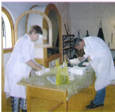
Állagvédelmi munka a segesi kiállításban

A megyei múzeum megalakulása óta a gyűjtemények folyamatosan gyarapodtak, legnagyobb mértékben a régészeti gyűjtemény, a folyamatosan végzett ásatásoknak, leletmentéseknek köszönhetően. A 1970-es évektől tervszerűen végzett nagyobb ásatásokat követően (Somogyvár, Kis-Balaton, Zamárdi, Segesd, Babócsa, Nagyberki-Szalacska, stb.), 1999-től a megyét átszelő korszerű úthálózatokkal összefüggő régészeti feltárások, fém-kerámia- és egyéb leleteinek konzerválása, restaurálása volt kiemelkedő feladat.