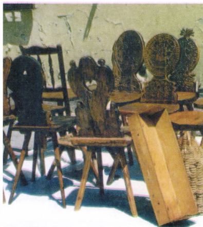
Kezelt néprajzi tárgyak

A megyei múzeum gyűjteményeinek állagvédelmét jelenleg 3 fő restaurátor végzi. Sokszor jelent problémát egy megfelelően képzett fa- illetve festményrestaurátor hiánya.