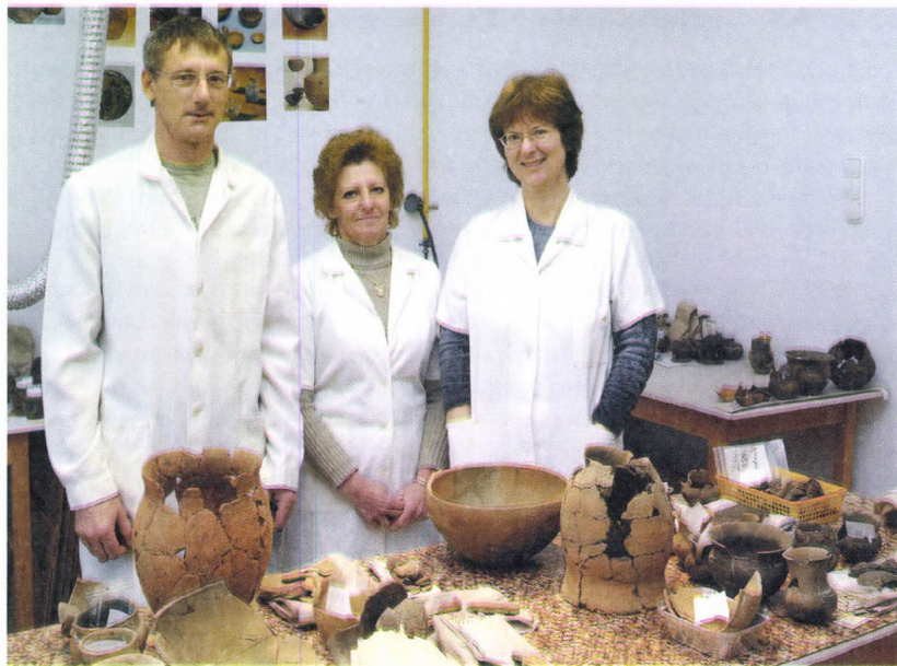
A Restaurátor Csoport munkatársai 2009-ben

Napjainkban egyre kiemelkedőbb jelentőségű a kulturális örökségünk védelme, melyben a restaurátoroknak is jelentős a szerepe. Munkájuk elengedhetetlen a múzeum szakembereinek tudományos munkájához, múltunk emlékeinek bemutatásához.