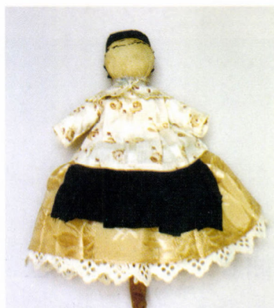
Néprazi baba restaurálás előtt és után