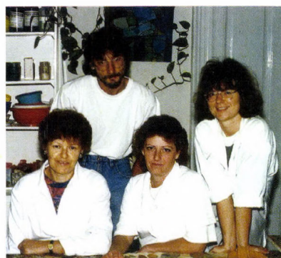
A Restaurátor Csoport munkatársai, 1995

A 1980-as évek közepére az addig korszerűnek mondható műhely elavulttá vált, a létszámnövekedés következtében a rendelkezésre álló terület kicsinek bizonyult.