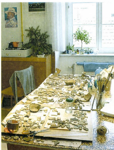
Kerámiarestaurátor műhelyek, 2004