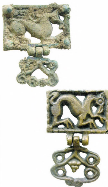
Bronz övveret kezelés előtt és után

Az országot átszelő korszerű úthálózat kiépítésébe megyénk is bekapcsolódott. Az ezzel összefüggő régészeti feltárások során előkerült, nagymennyiségű leletanyaggal folyamatosan bővült a múzeum gyűjteménye. Az anyag feldolgozására (tisztítására, rendszerezésére), új létesítményeket kellett létrehozni.