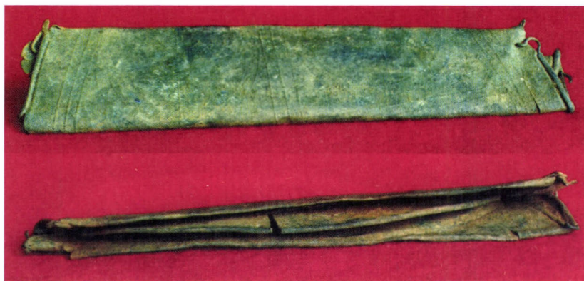
Későbronzkori bronz lábvert