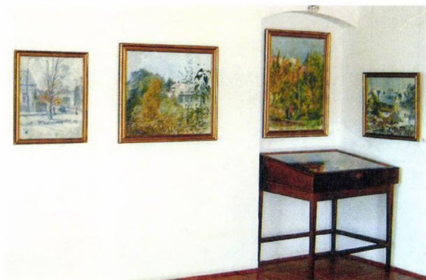
Raksányi Lajos festőművész állandó kiállítása

1995-ben Raksányi Lajos 50 festményével és pár személyes tárgyával nyílt meg első állandó kiállításunk. Itt látható többek között Raksányi Lajos tanári oklevele is, amit a vizsgabizottság elnökeként Színyi Merse Pál írt alá. Később, 1996-ban a néprajzi kiállítással bővítettük az állandó kiállítást „Csurgó néprajzi értékei a századfordulón” címmel.