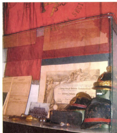
Kiállítás az Önkéntes Tűzoltó Egyesület tárgyaiból