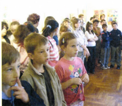
Kiállítás a művészet iskolások anyagából