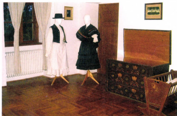
Részlet Csurgó néprajzi értékei a századfordulón c. állandó kiállításból