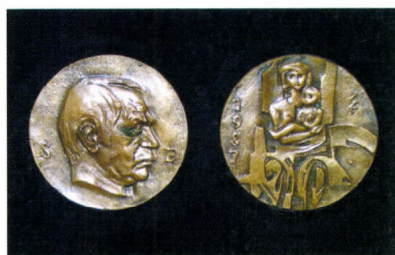
Soltra Elemér képzőművész kiállítása