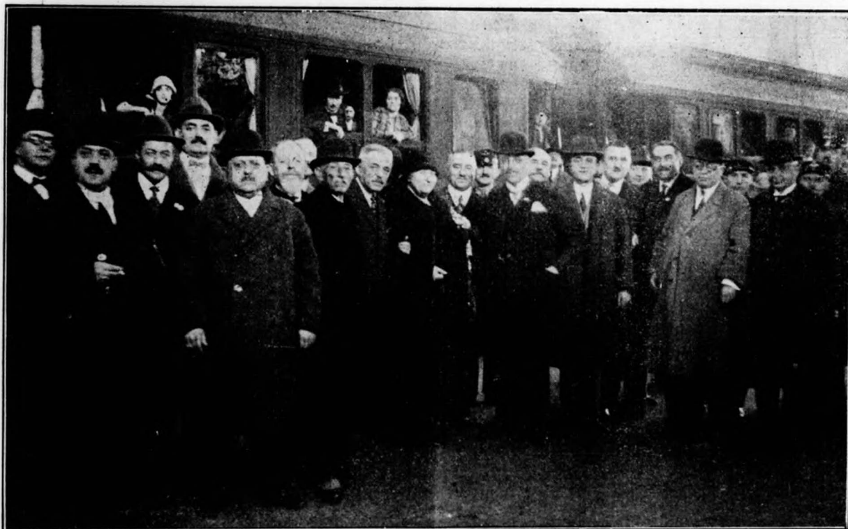
A wieni és berlini vendégek elutazása nov. 13-án.

A pusztá fizetés és az adófizetés kötelezettségének teljesítése még nem jelentik talán a legnagyobb terheket, mert hiszen tudjuk, hogy