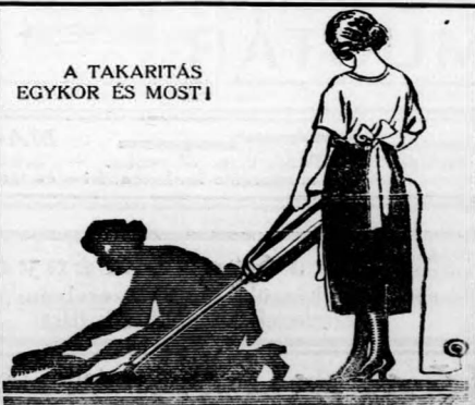
A TAKARÍTÁS EGYKOR ÉS MOST!

Kérje díjtalan, kötelezettség nélküli bemutatását az Elektrolux Társaság , ezelőtt Turbator Company Rt. cégtől, Budapest, V., Arany János u. 10. 1926. január 15-től: IV., Kristóf tér 2. Telefon: 109-87 és 912-91 Fiókjaink: Debrecen, Győr, Miskolc, Pécs, Szeged, Szombathely, Arad, Nagyvárad, Temesvár Kérje a cég „K” jelű prospektusát!