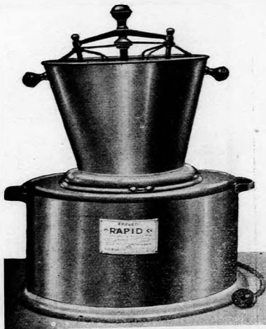
Szabadalom bej. — Törv. védve.

a tökéletes, légn nyomással működő tejszinhab-készülék