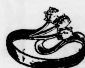
Valódi 14 kar. arany fantasie gyűrű tűzopálokkal 4 frt, színes kövekkel 3 frt 75.