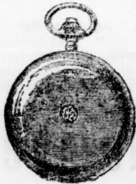
Valódi 14 karatos arany női óra egy fedelű 14 frt; dupla fedelű 18. vaserős tokban egy fedelű 17, duplafedelű 30., ugyanez gyémántokkal diszítve 35 frt. briliántokkal 50 frt.

Csodaszép pazar kiállítású alkalmi ajándéktárgyak: világhírű, bámulatos pontosság- gal járó órák A legnagyobb igényeket kielégítő legujabb façonu arany és ezüst ékszerek. Legszolidabb kivitelű ezüst-, dísz- és használati tárgyak. Minden darab a m. kir. fő fémjelző hivatal bélyegzőjével ellátva. Most jelent meg nagy képes árjegyzékem, melyet menyasszonyok, vőlegények, valamint a n. é. karácsonyi vásárló közönség figyelmébe ajánlok, bárkinek díjtalanul küldetik meg.