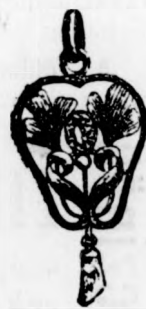
Pazar kiállítású nyak- lánc-estűngő valódi tűzopá- lokkal 7 frt, gyémántokkal 25-30 frt, briliántokkal 45 frt.