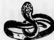
Valódi 14 kar. arany kígyó gyűrű, zöld, piros vagy kék kő fejjel 6-8 forint.