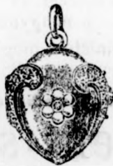
Valódi 14 kar. arany szív kövekkel diszítve csu- kott 3 frt 50, nyitható két képre 7 frt. Ehez valódi 14 kar. arany erős nyaklánc 7 frttől.