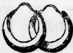
Valódi 14 kar. arany karikafüggő 2 frt képre 7 frt. Ehez valódi 14 kar. arany erős nyaklánc 3-50.