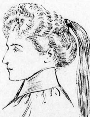
3. ábra. Az oldalt elválasztott hajat kissé toupirozzuk és lazán előre alkalmazzuk, hogy a végek a hátsó hajjal egyesüljenek, ha a haj egyenlőtlen hosszúságú, úgy oldalfésűket alkalmazunk.