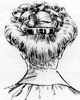
5. ábra. A megalkotott láncsomót felfelé alkalmazzuk és kissé széjjelhuzzuk, vagy magasságban, vagy laposan, amint az archoz jobban illik. A csomó alatt széles nyakfésűt alkalmazunk.