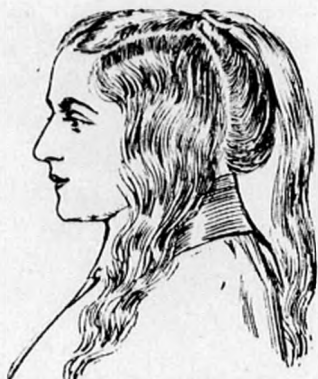
1. ábra. A haj kifésülése és kefézése után a hajat a fül mellett elválasztjuk, az előhajat a hátsóhajjal a fejtetőn megkötjük, az oldalhaját kissé hullámossá tesszük.