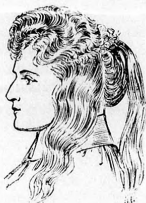
3. ábra. A hullámos seitlit mindkét oldalon megtűzzük, kissé toupirozzuk és lazán az arc felé hozzuk.