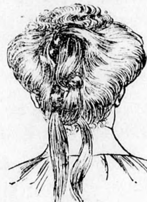
4. ábra. A megkötött hajat kétfelé választjuk és láncsomót alkotunk, mint ábránk mutatja.