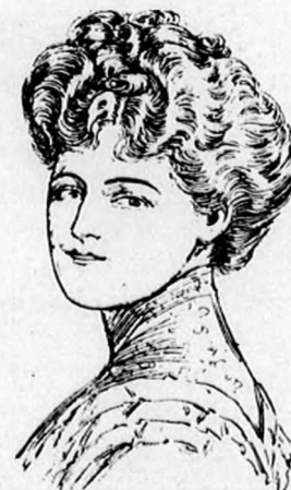
6. ábra. Elöl úgy igazítjuk a hajat, hogy néhány fürtöcske a homlokba essen és az előhajat lazán a homlokba huzzuk.