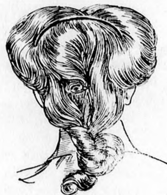
3. ábra. Most a másik előrészt ugyanilyen módon erősítjük meg, mire mögötte fésüt alkalmazunk, hogy az előhajnak biztos tartása legyen, a hajvégeket hajtőre csavarva aládugjuk, a hátulsó hajból pedig csomót alkotunk, miként az ábrán látható.