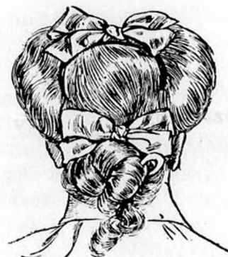
4. ábra. Ezen hátulsó csomót egymásra fektetjük és lazára széjjelhuzzuk és minden oldalon megerősítjük, a hajvégekből pedig fürtöket sütünk.