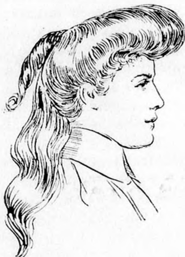
2. ábra. Az előhaját három részben toupirozzuk, mire a közép és jobboldali részt összevesszük, ezen részeket kezünkre fektetve átkeféljük és félhajlással befelé fordítva, lazán archoz tolva, a fejtetőn megerősítjük.