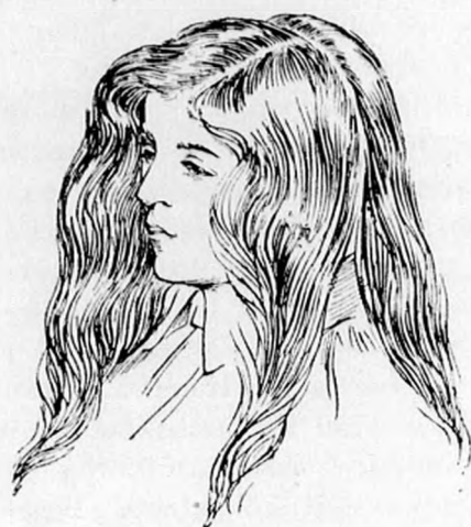
1. ábra. Miután a haját jól kikeféltük és kifésültük, a bal szem fölött elválasztjuk és keresztben is elválasztjuk az egyik fültől a másikig.