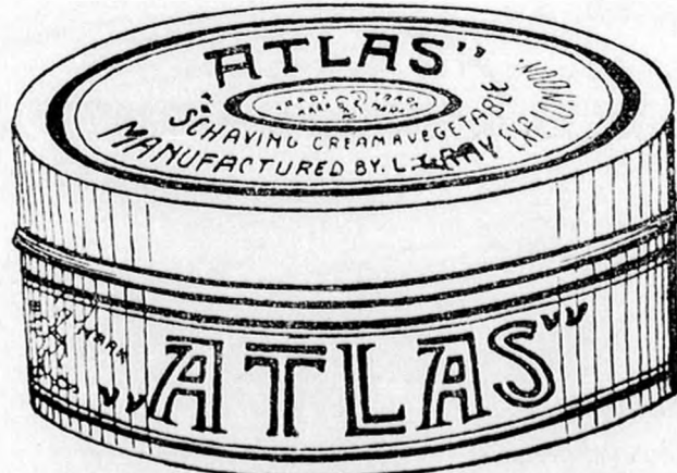
1 kilo K 1.60