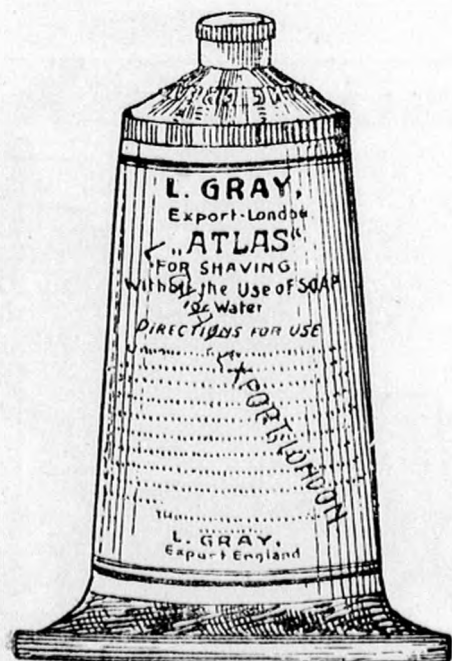
Nagy tubus K 1—, kis tubus 70 fill.

Vidéki megrendelések pontosan eszközöltetnek.