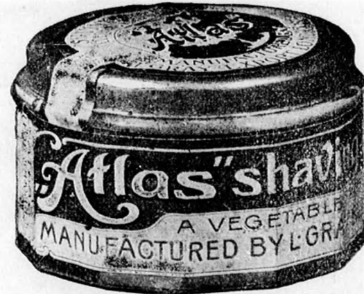
Üveg tégely 80 fill.