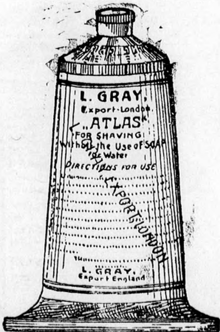
Nagy tubus K 1—, kis tubus 70 fill.

Vidéki megrendelések pontosan eszközöztetnek.