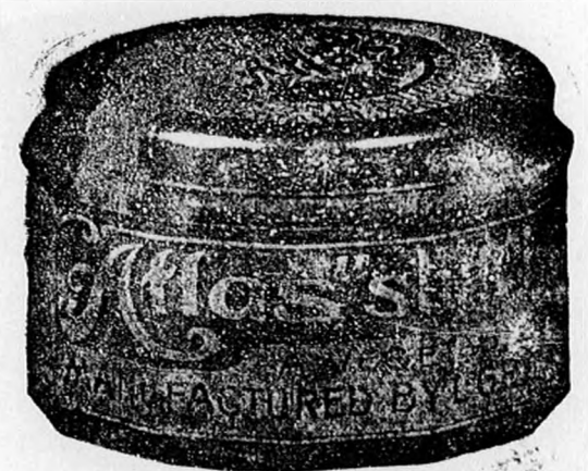
Üveg tégely 80 fill.

„ATLAS“ borotváló krémet mutatóujjal kell a szakállra kenni, azaz csak megsimogatni és utána röktön meglepő könnyen borotvál; nincs oly kényes szakáll, mely borotválás közben kipattanna, bármily soká és erősen is utána borotvál.