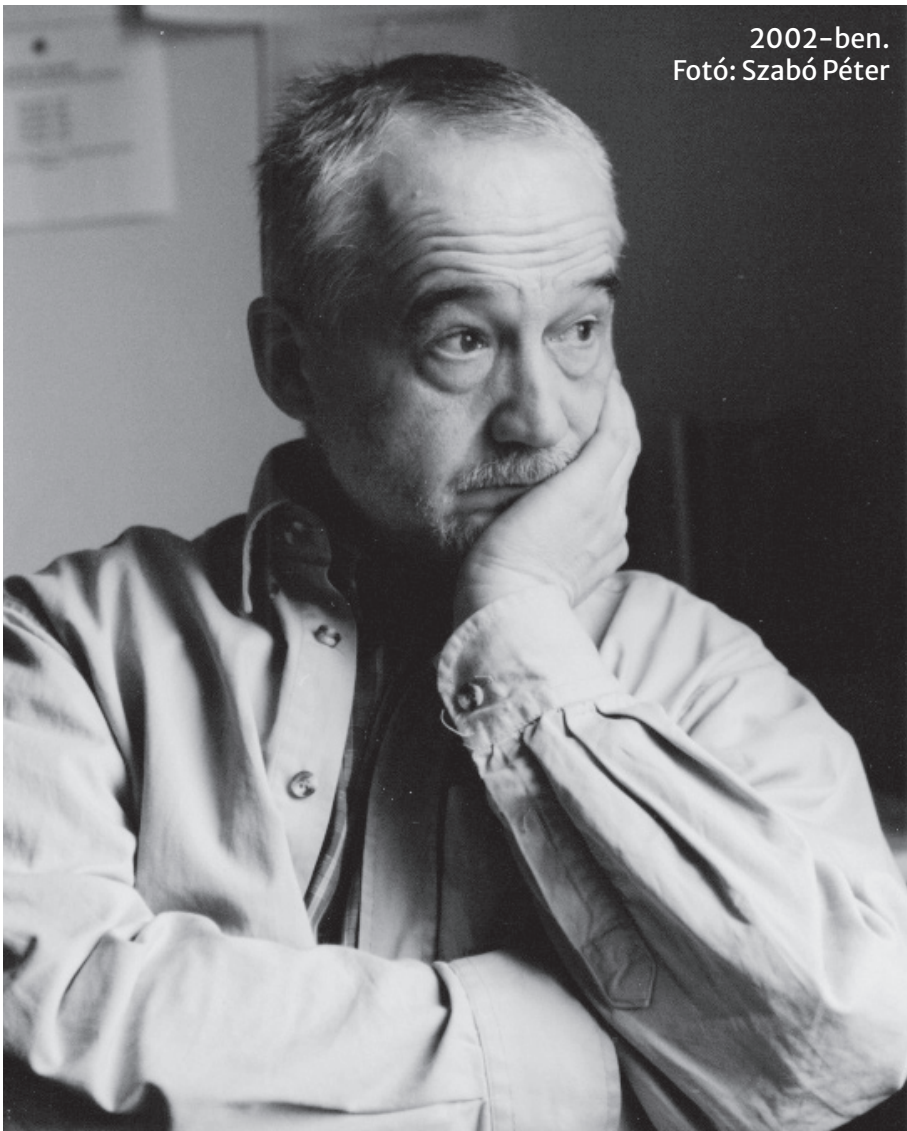
2002-ben.