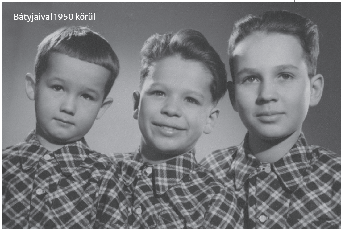
Bátyjaival 1950 körül

el mindkét hangszeren, azt meg lehet csinálni. Liszt Ferenc eljátszott zongorán Paganini-darabokat, de egészen biztosan nem gondolt arra, hogy úgy kellene zongoráznia, mintha hegedű szólna. Inkább valami olyasmit érzek, mintha élesedne a figyelmem, még inkább észreveszem a nyelvi különbségeket, hogy valami nagyon máshogy van magyarul, esetleg nem is lehet magyarul mondani. Fordítok éppen egy színdarabot a Thália Színháznak, amiben elhangzik a következő mondat: Music is a discipline . Ez arra utalna, hogy a zenészek vegyék komolyabban a feladatukat. Először úgy fordítottam, hogy a „zene az egy dresszúra”, de figyelmeztettek, hogy ezt a szót manapság már senki nem használja. Így végül az lett a megoldás, hogy a „zene fegyelmet kíván”, ami szép is, magyarul is van, de mégsem ugyanazt jelenti, mint az eredeti angol mondat. Ez a megoldás ugyanis arra utal, hogy addig kell fegyelmeztetnek lenni, amíg zenélsz, az eredeti viszont arra, hogy ez az egész létedre vonatkozik zenészként, be vagy zárva ebbe a hivatásba.