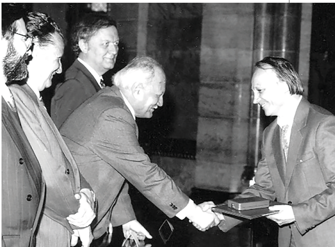
A Magyar Köztársasági Érdemrend tisztikeresztjének átvétele 1994-ben

zátok jöttem, 1966; Nincsen nyugalom, 1970; Ma és mindennap, 1975; Bűntelenül, 1982; Holddal világítottunk, 1984; Veszteségeink gyűlnek, 1989; Félország, félvilág, 1995; Virág, 2003; Közel, távol, 2003; Megfordult égtájak, 2008; A magunk szárnyán, 2011; Világfa, 2012; Égig érő nyár, 2012.