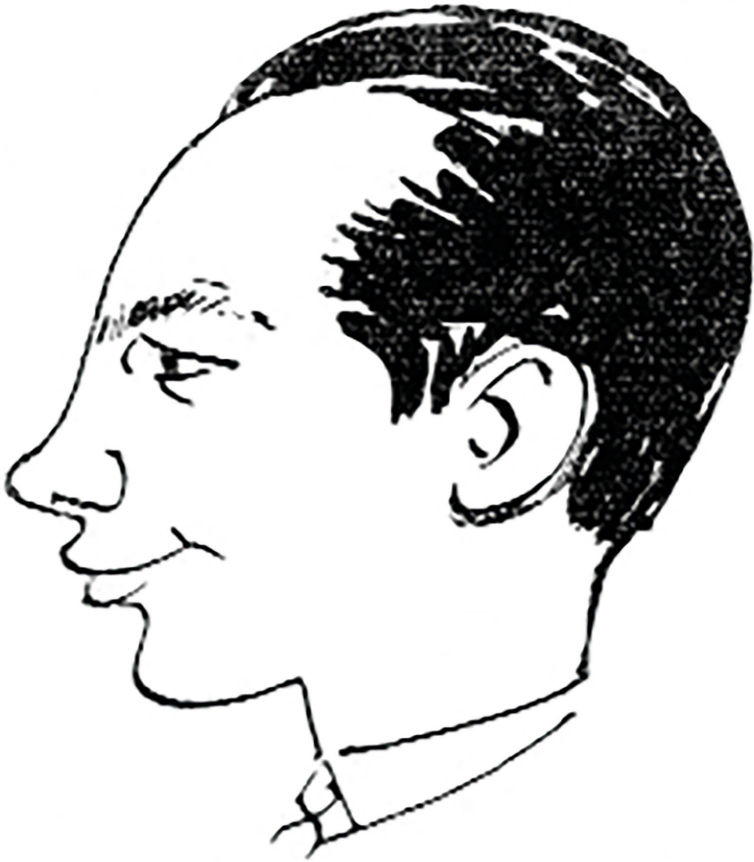
Az Új Írás Serfőző-karikatúrája 1961 júniusában (Masznyik István rajza)

lókhoz. „Világos benne az önéletrajzi jelleg, és ezért a költő és író gyökereihez még közelebb jutunk. Vasy Géza szavaival ez vallo-más az eredetről. Az informatív érték sem csekély, hiszen olyan valóságot ismerünk meg általa, amely ma már jórészt ismeretlen előttünk.” (Bakonyi István: Serfőző Simon pályaképe , MMA)