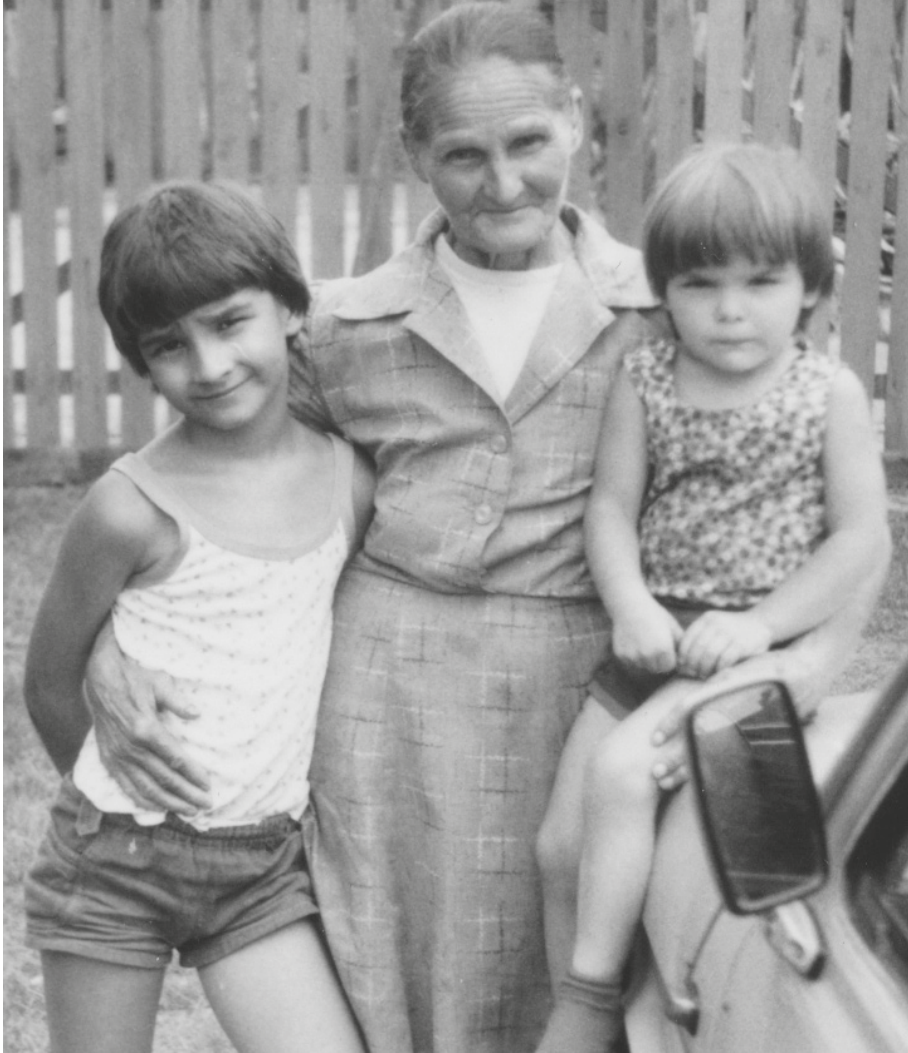
Serfőző nagymama az unokáival

Jelentős Serfőző prózai munkássága, e sorok írójának egyik nagy kedvence a Gyerekidő regénytrilógia. A regény főhőse Matyi, a tanyán élő kisfiú. Gyerekről szól a könyv, mégsem gyerekrégeny, miként Móricz remekműve, a Légy jó mindhalálig sem az – regény, mégpedig nagyon jó regény. Életrajzi regény: narrátor és regényhős egyazon személy, vagyis az író, aki életének legmeghatározóbb, élményekben leggazdagabb szakaszát, gyerekkorát írta meg szociografikus pontossággal, a tanyasi világot láttató erővel. Serfőző regénye, Veres Péter kifejezésével élve, sültrealista: nem idealizál, nincsenek fikciós elemei. A móríci hagyományt viszi tovább, eleven képet fest az ábrázolni kívánt világról és korról. A háttérben ott komorlik az ötvenes évek nyomasztó világa, a Rákosi-diktatúra a beadásokkal, az örökös rettegéssel, ami rányomja bélyegét Matyi zsenge éveire, és nagy hatással lesz írói munkásságára.