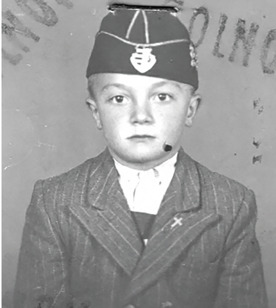
Az általános iskolai tanulmányok kezdetén 1949-ben (vasúti igazolványkép)

Máig se tudom, hogy amiket akkoriban megéltem: rászorítottságomat a magam kenyerére, az albérleteket, vasági kucorgásaimat, jövőtlenségemet, szüleim félelmeit a kiszolgáltatottságtól, a falusiak maguk közül történő kiutasítását, „haza ne merészeljünk menni”, vajon meg tudtam-e írni. Örökös a hiányérzet bennem. Pedig csaknem minden műfajban megkíséreltem – riportban, regényben, elbeszélésben, drámában, versben –, hogy ezt a munkát elvégezzem. Legszívesebben ezeket az időket írnám újra és újra. Nem csak azért, mert hol itt, hol ott találok valami javítanivalót a szövegeimen – ami sohasem a lényegét érinti, azok miatt nem kell lesütnöm a szemem –, hanem hogy helyén legyen minden szó.