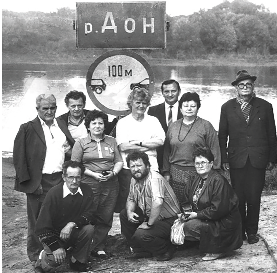
A doni zárándokút résztvevőinek csoportja 1995 körül

fejezi ki. ...Azt mondhatjuk, hogy a költő mint költő csak közvetve van elkötelezve népének: közvetlenül a nyelvének van elkötelezve; első feladata, hogy megőrizze azt, a második, hogy kitágítsa és finomítsa. Mikor kifejezi azt, amit más emberek éreznek, egyszermind meg is változtatja az érzést, azzal, hogy tudatosítja; az embereket ráébreszti arra, mit is éreztek addig, és ezzel önismeretre neveli őket. ...a költészet a társadalom, a közösség valamennyi tagjának, az egész népnek a beszédét, az érzékenységet, az életét befolyásolja, függetlenül attól, hogy olvassák és élvezik-e a költészetet vagy sem, sőt, még attól is, hogy ismerik-e legnagyobb költőik nevét vagy sem... Európa minden egyes népének érdeke, hogy a többinek továbbra is legyen költészete.”