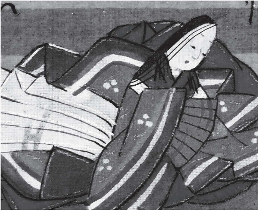
A kép Kosikibu no Naisit ábrázolja egy XVIII. századi verskártyán (magángyűjtemény)

XI. századi japán költőnők rögtönzött versei