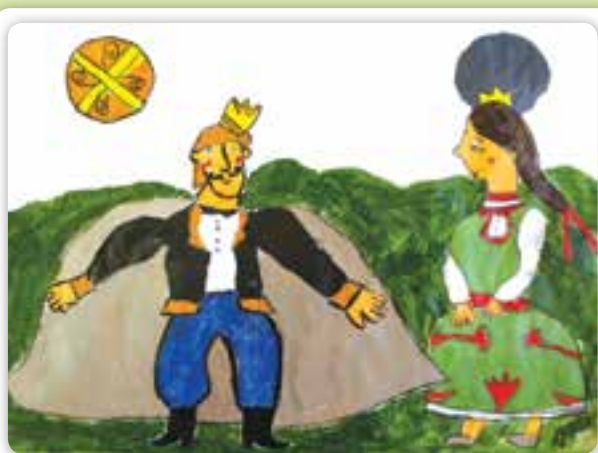
Marci és az elátkozott királynő Szarvadi Arnold rajza, Belényes