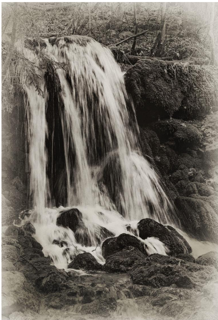
VEHOFSICS ERZSÉBET: MYRA VÍZESÉS