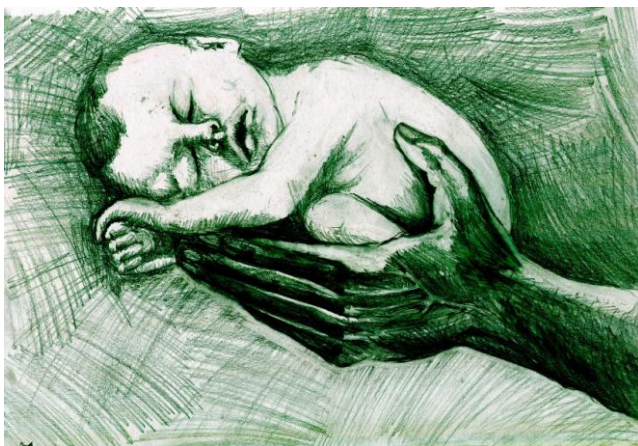
Imre Ádám: Apa gyerekkel

Erotikus Sátán lettem, Véredben közömbösen állok. Mondom: visszatértem, Nincs rózsaszínű átok, Harcod szakadék felett – Az alján és sem várok.