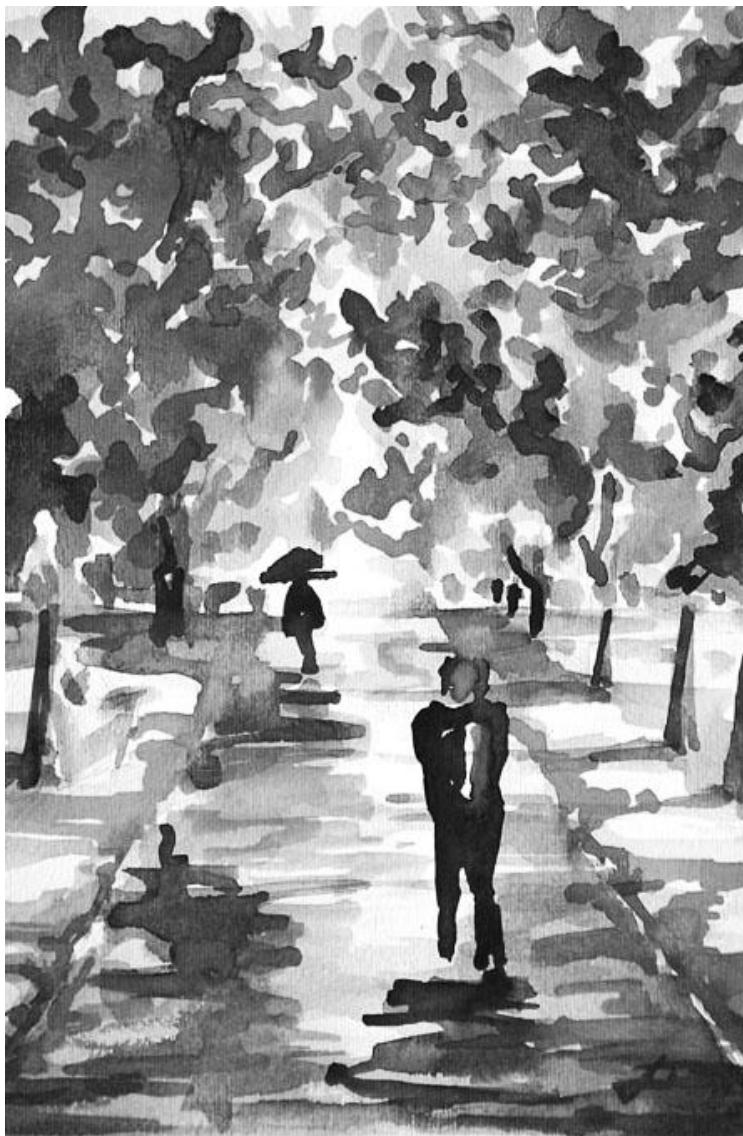
FENYVESI EDIT: MAGÁNYOSAN