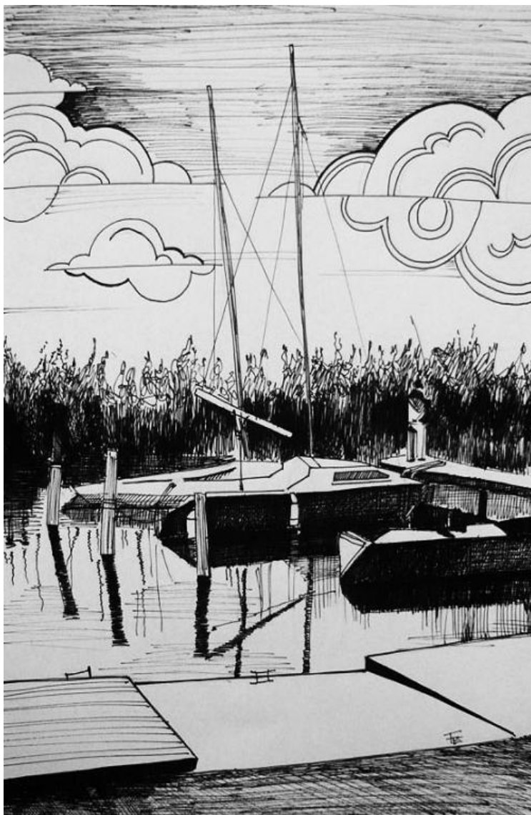
FENYVESI EDIT: HÉTVÉGE