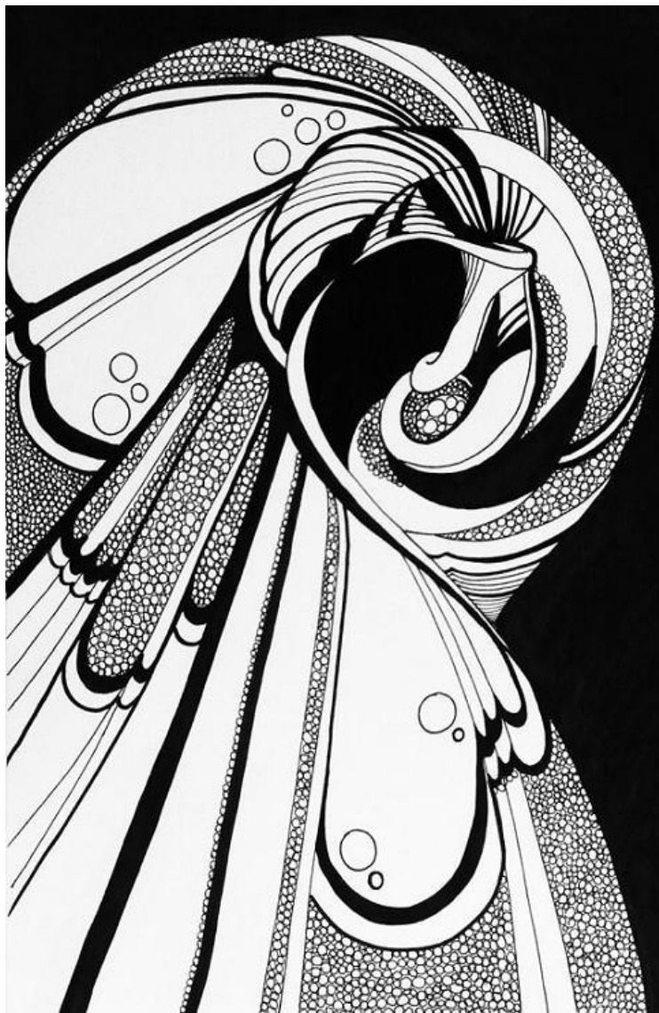
FENYVESI EDIT: SODRÁS