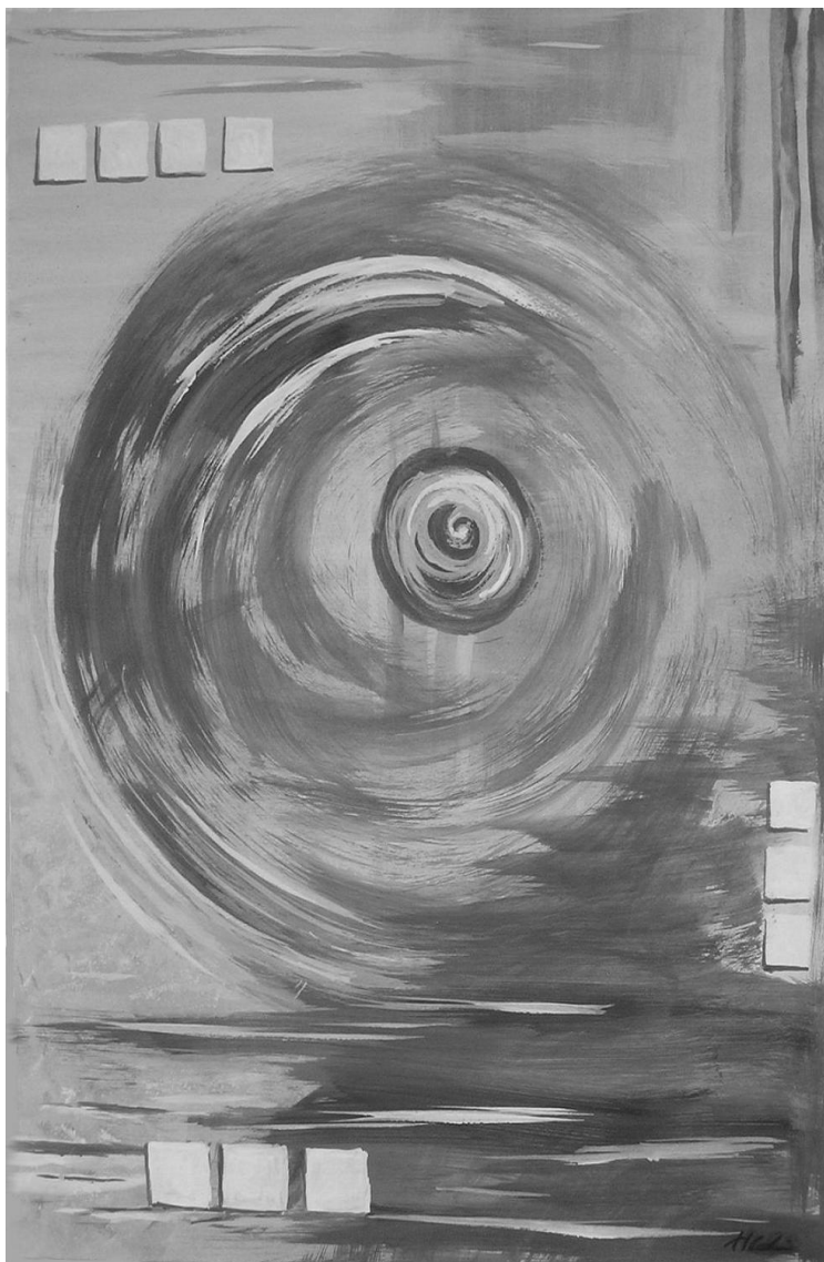
TOLDINÉ HORVÁTH ILDIKÓ: ÖRVÉNY