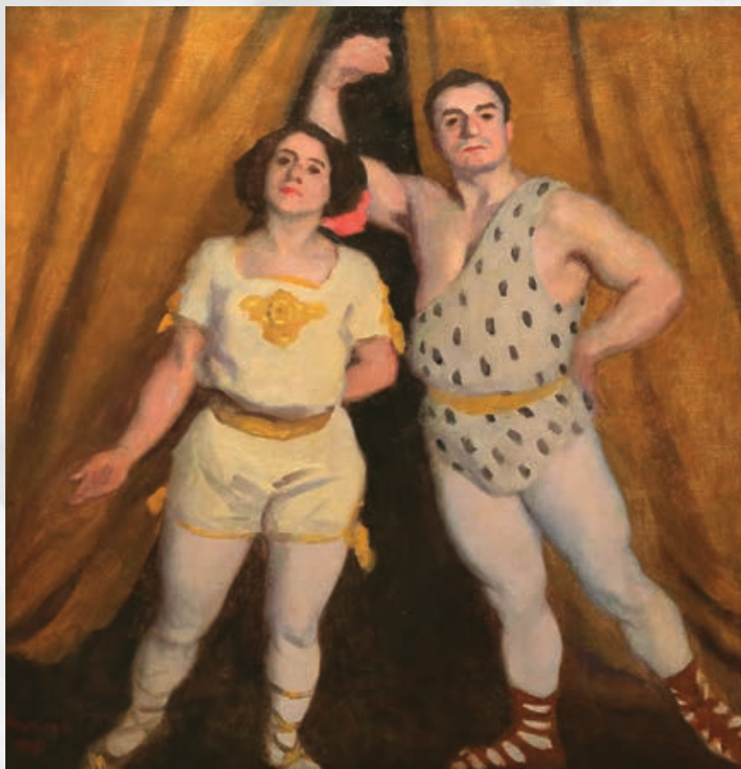
Ferenczy Károly: Artistapár (1912, olaj, vászon)

Ferenczy Károly (1862–1917) a századelő magyarországi festészetének kiemelkedően fontos mestere volt.