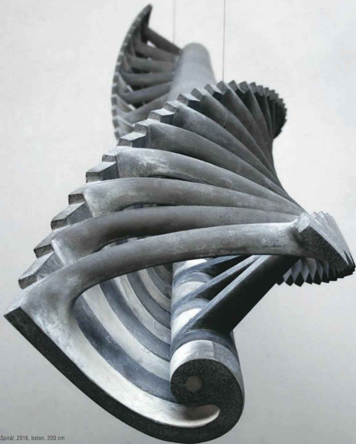
Spirál , 2016, beton, 200 cm