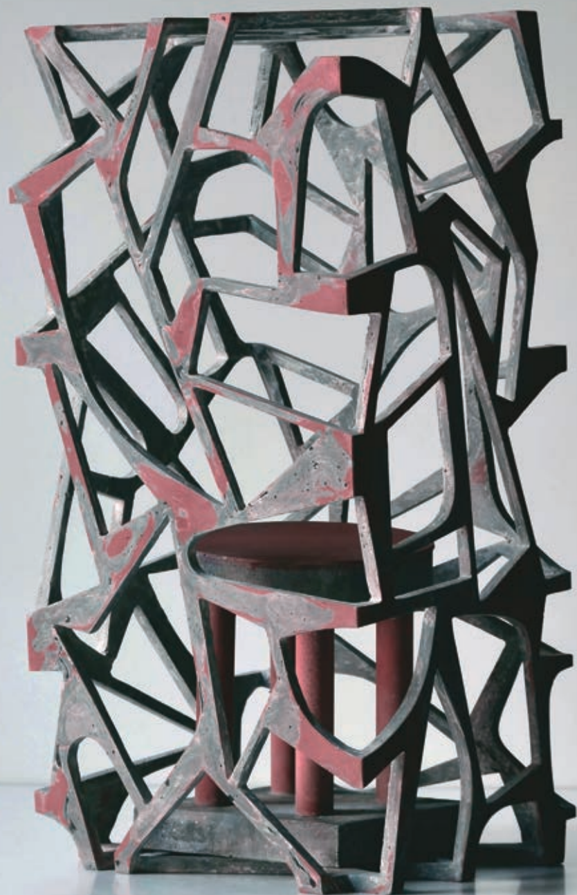
Vegetábilis függő II. 2009, anyagában színezet beton, 57 cm