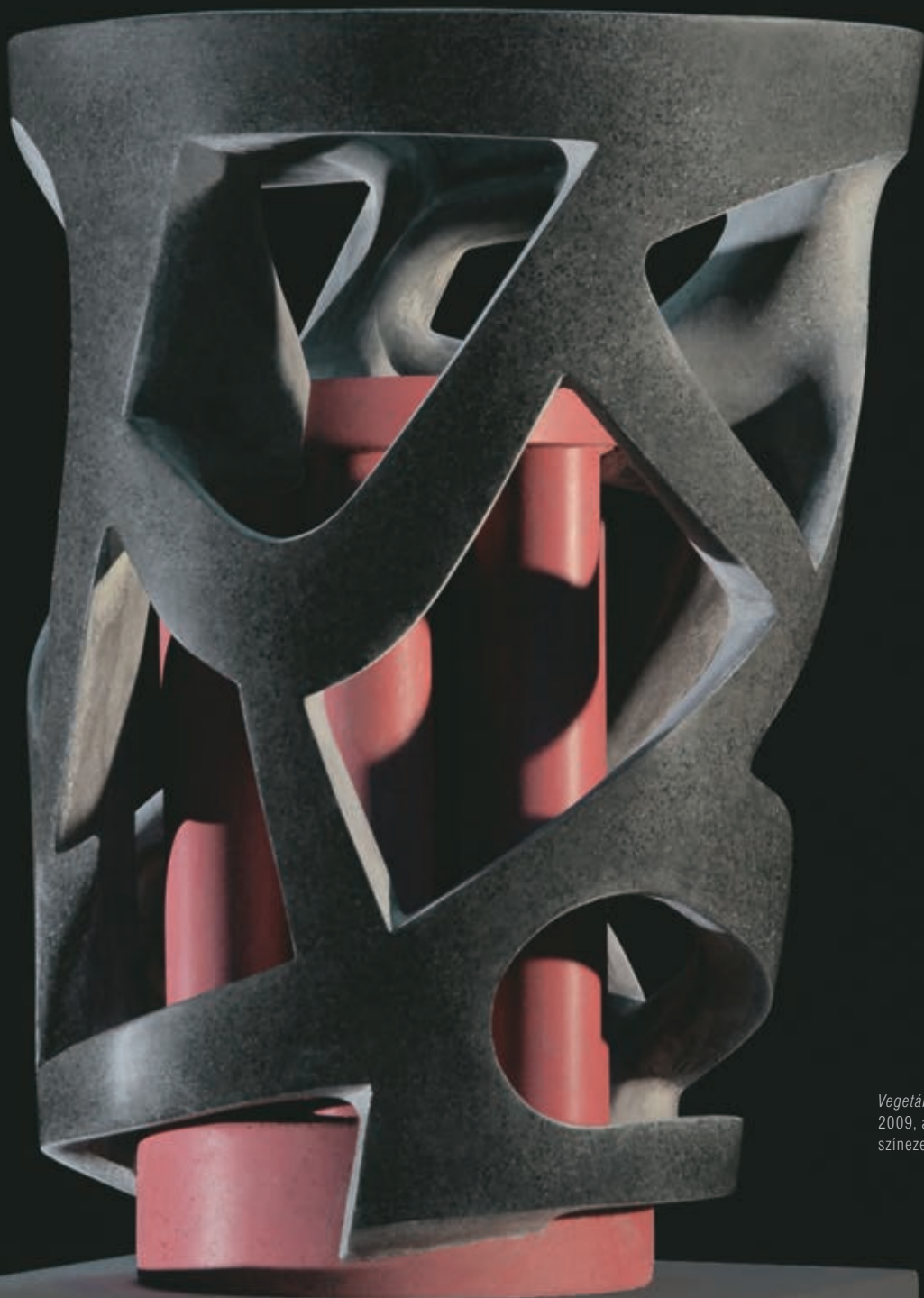
Vegetábilis függő I., 2009, anyagában színezett beton, 59 cm