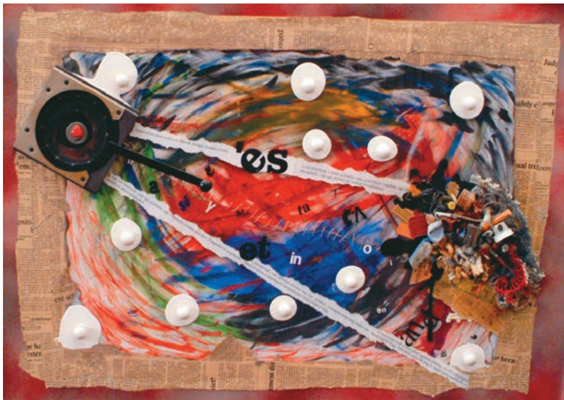
Merz – Kurt Schwitters emlékére