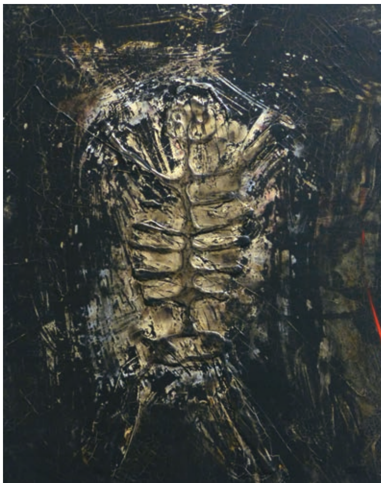
Freisinger Balázs: Expedíció

itt hű kutya, ott szűz migger, áj vúdkám haza.