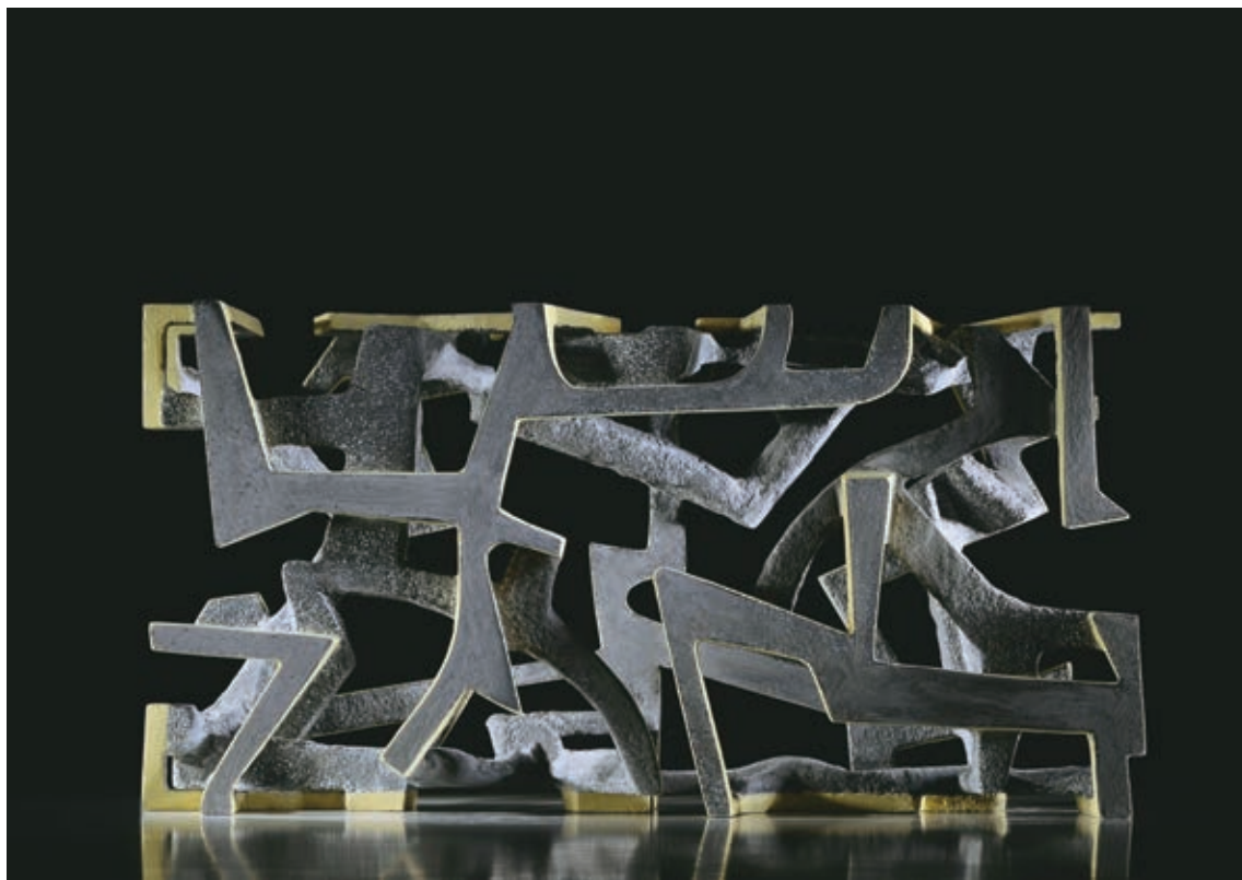
Titok , 2015, festett beton, 25,5 × 14 × 51 cm

egy-egy támpontot, megjelölnek néhány szimbolikus-metaforikus kört, hogy megkezdhessük értelmezési kísérleteinket, de a teljes együttes alapvetően az elvonatkoztatás, a fogalmiság szféráiba kalauzol. A gondolatiságnak abba a birodalmába, ahol kapcsolatokra és elválásokra, összefüggésekre és különállásokra, viszonyokra, erőkre, behatásokra és ellenállásokra, mozgásokra és mozdulatlanságokra, dinamikára és nyugalomra, szabályra és szabálytalanságra, biztosságra és bizonytalanságra, feszültségre és kiegyenlítődesre, mindezek fennforgására gondolhatunk és gyanakodhatunk. Mert a Csurgai-szobor nem az úgynevezett „valóság” leképezése és nem is tükröztetése, hanem egy új, plasztikainak nevezett valóság kreációja. Tömegeiben, szerkezeteiben, testeiben és vázaiban, megtestesüléseiben és ürességeiben ott munkál a maga megfejthetetlen titkaival meghatározott és áthatott létezés.