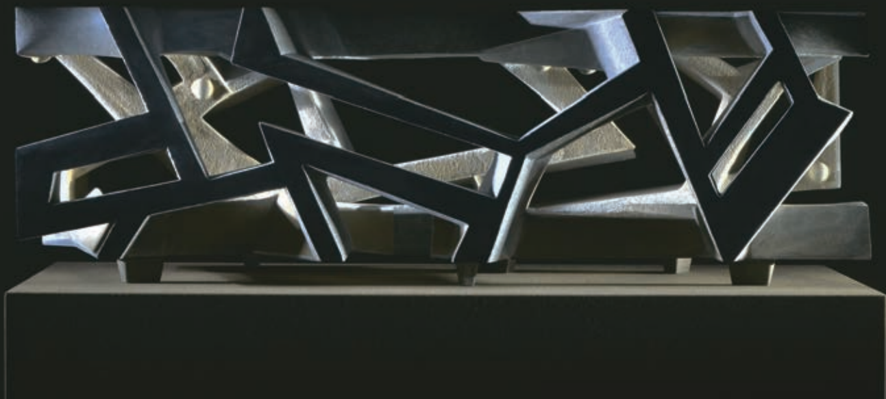
Emlékeztető, 2010, beton, 24 × 24 × 84 cm