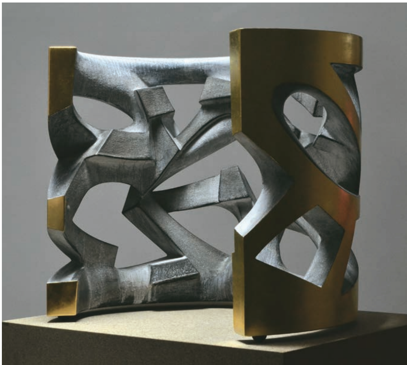
Átjáró , 2010, beton, arany, 56 × 52 × 68 cm