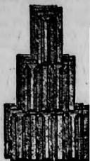
Nagykikindai gyártmány. Bohn-féle szab. biztonsági átfedő eserep 272. szám.

Képes árjegyzék és minták kívánatra ingyen és bérmentve.