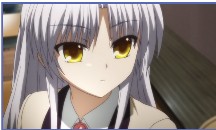
Képen: Kanade Tachibana az Angel Beats-ből

testesül meg a moe. Személy szerint nem tudok moének tekinteni egy tsundere karaktert, pedig a két tulajdonság olykor együtt jár. Amikor a moéről beszélek, akkor általában Kanade Tachibana karaktert hozom példának az Angel Beats!-ből. Róla az elején senki se gondolja, hogy ténylegesen moe, csak később figyelhető meg, hogy mindig egyedül van, nincsenek barátai, kevésbé beszédes, meg hát ugye mindenki bántja, pedig ő csak jót akar. Megrajzolása kawaii, és kicsivel fiatalabb is a többi szereplőnél. A sorozat végére abszolút szeretetérzetet vált ki a nézőből. De nála egyszerűbb példa Misaka Misaka (más néven Last Order) a To Aru Majutsu no Indexből. Ő tipikus underage, amikor megismerjük még ruhája sincs, ráadásul folyton kiemelik az arcán a rózsaszín pírt – ezzel is jelezve gyermek mivoltát. A moe karakter esetében még megjegyeznék annyit, hogy aki több példát szeretne találni, azoknak ajánlom a Saimoe szavazást, ahol minden évben megválasztják az "Év Moéja" díj győztesét. Hozzáteszem, általában nem értek egyet a szavazással, mert sok olyan karakter is bekerül, aki véletlenül sem moe, de itt tényleg sok példát találhattok.