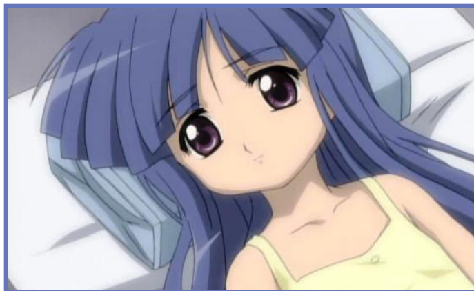
Képen: Rika Furude a Higurashi no Naku Koro ni-ből

Ennyit szerettem volna jelen cikkemben bemutatni, viszont mindenképpen szeretném kikötni, hogy rengeteg olyan karaktertípus létezik még az animék világában, amivel nem foglalkoztam, viszont sok helyen előfordulnak, és érdekes lehet egy-két dolgot megtudni róluk. Akik további információkat szeretnének egy-egy karaktertípusról, azoknak ajánlom elsősorban a Wikipédiát, vagy az Urban Dictionaryt, az angolul nem tudóknak pedig az animékkel foglalkozó blogokat, például Sunyi Nyufi blogját, Kvakond Anime Review blogját, vagy Andy anime blogját (mondjuk utóbbi kettő pont inaktív, de attól még hasznosak), mert az ottani írásokban sokszor találni hasznos bejegyzéseket a témával kapcsolatban. Remélem élveztetek a cikket, és tudtam valami újjal szolgálni számotokra. További kellemes olvasást kívánok!