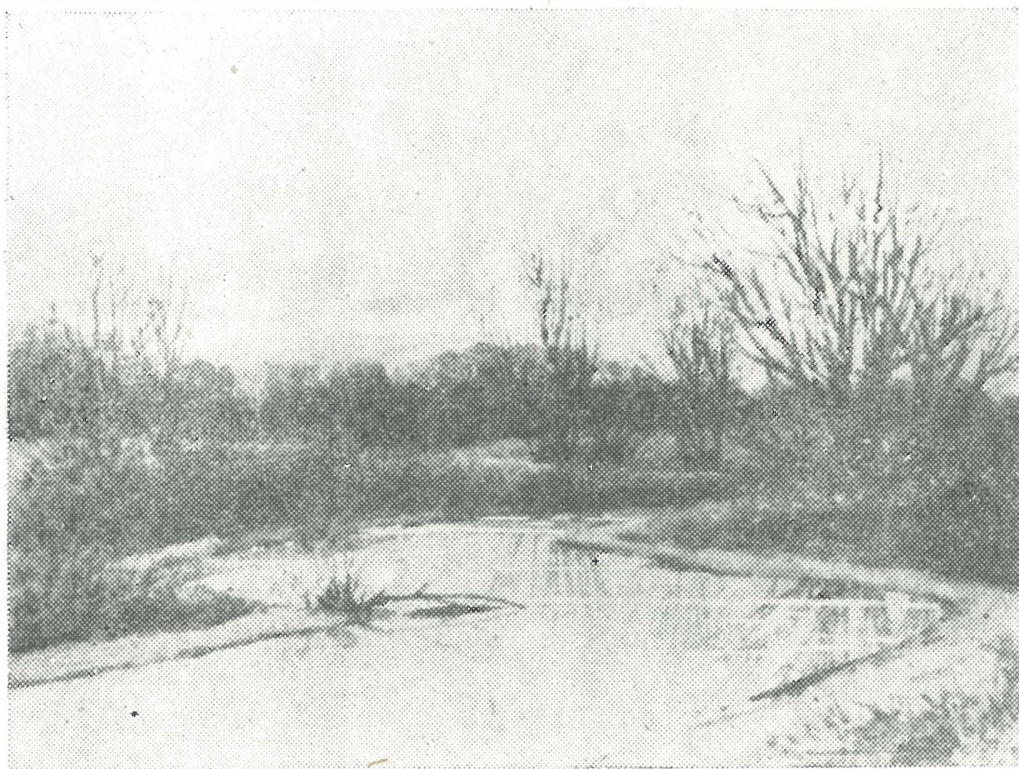
Fig. 1. — Diószeghy L.: Peisaj de iarnă. — Winterlandschaft. Muzeul Regional Sf. Gheorghe.

În perioada ultimă a vieții lui a lucrat pentru Muzeul British din Londra. În anul 1931 a luat parte la cercetarea științifică executată sub conducerea Muzeului Național Secuiesc. Rezultatul cercetării sale științifice l-a și publicat în diferite reviste. Titlurile lucrărilor sale sînt: Die Lepidopterenfauna des Retyezát-Gebirges (Verhandlungen und Mitteilungen des Siebenbürgischen Vereins für Naturwissenschaften zu Hermannstadt