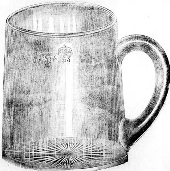
1756 B szám.