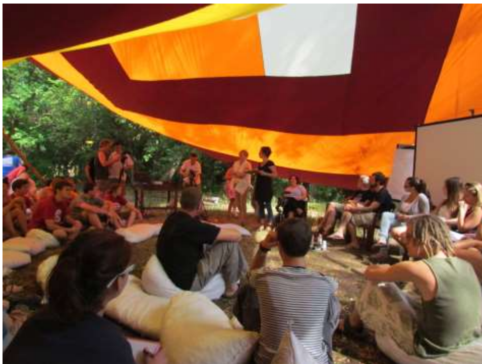
Vitaindító előadás és panelbeszélgetés

Elhangzott a X. Nyári Egyetemen 2013. július 25.-én