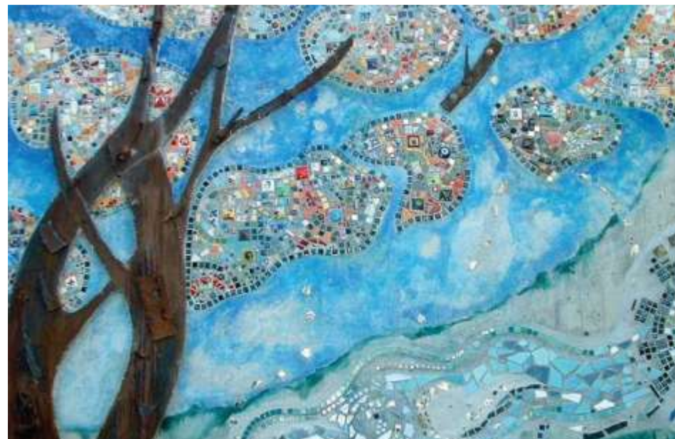
Sagena Mural: A közösség és a részvétel nyilvános hitvallása

a résztvevők. Az esemény meglehetősen sok embert vonzott – minden oldalról lelkes javaslatok érkeztek.