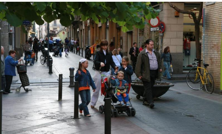
Gyalogosbarát utca a gráciai szomszédságban

„Ez a terv összefogja a városi ökológia lényegét” – teszi hozzá Sanz. „A célunk az, hogy Barcelona olyan város legyen, ahol jó élni. Egy mediterrán város lakói az idejük nagy részét az utcán töltik, épp ezért fontos, hogy ezekre az utcákra az emberek második otthonuként, vagy a mindenkori életterük kiterjesztéseként tekintsenek. A köztereknek a játék tereivé kell válniuk, ahol valósággá válik a zöldterület, és ahol a szomszédság története és a helyi élet is jelen van.”