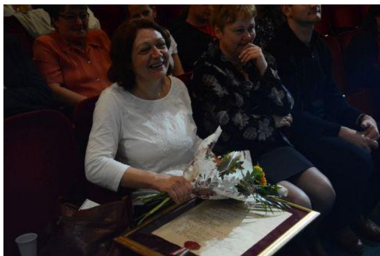
Az esemény galériáját itt tekintheti meg

A rangos esemény zárásaként lépett a szakmai nyilvánosság elé a faluház mozgalmat feldolgozó, Makovecz Imre és a közösségfejlesztés szakmai alapjait lefektető szakemberek, köztük Beke Pál szellemiségét megidéző „Belül kell felépíteni a házat – Faluház mozgalom és közösségfejlesztés” című film. A hiánypótló filmet Zajti Ferenc rendezte, elkészítését a Magyar Művészeti Akadémia támogatta.