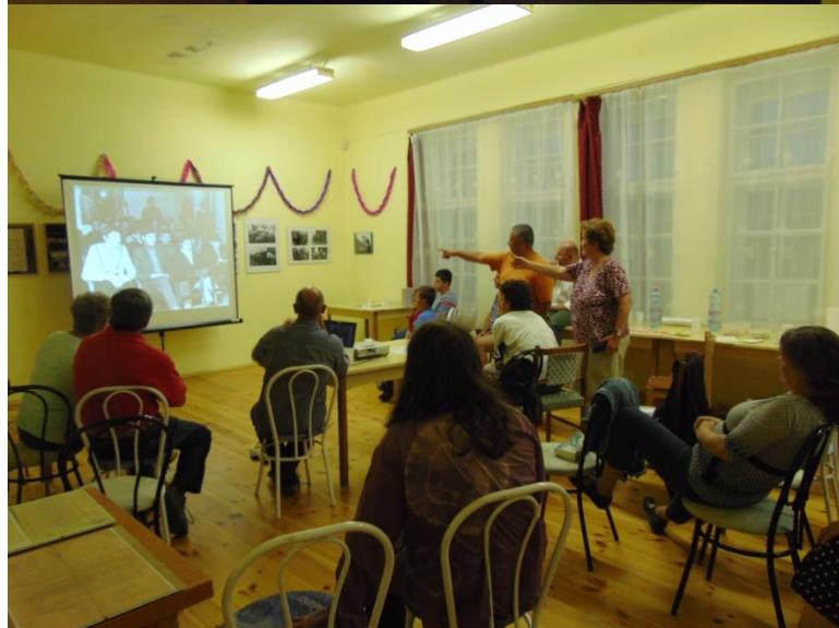
Vetítés a kiállítás képeiből

A modern közösségiség feltételezi az aktív részvételt a település sorsának alakításában, s ezt tették elődeink teljesen természetesen, szerepet vállalva a közösségi élet minden területén.