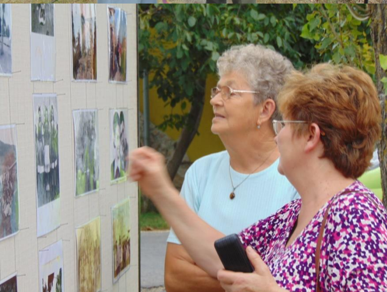
Találkozások a jelenben

A Kunság szülötte, Győrffy István így fogalmaz már 1939-ben: