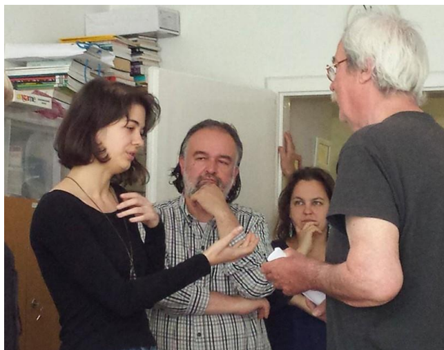
Képzők képzője.

A program fentebb ismertetett alapszintű szakmai támogatása mellett számos egyéb segítség igénybevételére teremtettünk lehetőséget.