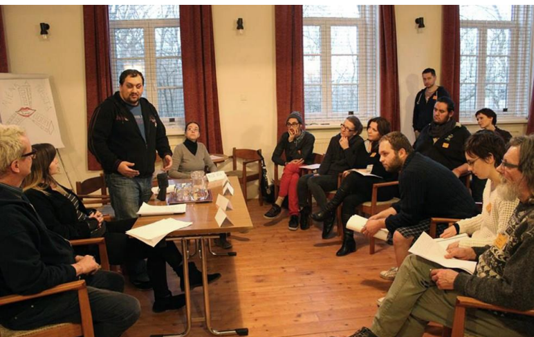
Közösségi vezetőképzés.

A CKA és partnerei elmúlt 6 éves munkájának fontos eredménye, hogy a fenti témákban már sikerült jelentős eredményeket elérni és stabilizálni az országossá váló építkezést. A nagyszámú elérésekből kialakultak a hazai kezdeményezők, létrejöttek az első példák, esettanulmányok, hazai képzések, konzultációk, erőforrás-központ, nemzetközi kapcsolatrendszer. Mindez számos elemében bizonyította, hogy egy újfajta megközelítéssel, szemlélettel és alulról induló szisztematikus építkezéssel a leghátrányosabb helyzetű csoportok is képesek: