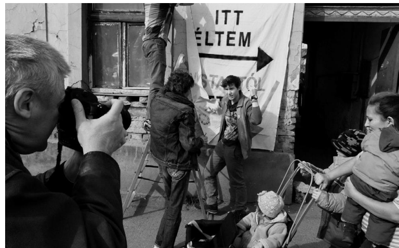
Az AVM Pécs akcióban.

„A hajléktalan emberek kriminalizálása mellett még két fő helyi problémát vázoltunk fel közösen, a város nem megfelelő szociális bérlakás állományából fakadó áldatlan lakáshelyzetet és a hajléktalan ellátórendszer hiányosságait. A három fő feladatot megpróbáltuk munkacsoportba sorolni, de ez még nyolc fővel nem sikerült, ezért egy negyedik fontos feladatot is besoroltunk, a toborzást.”