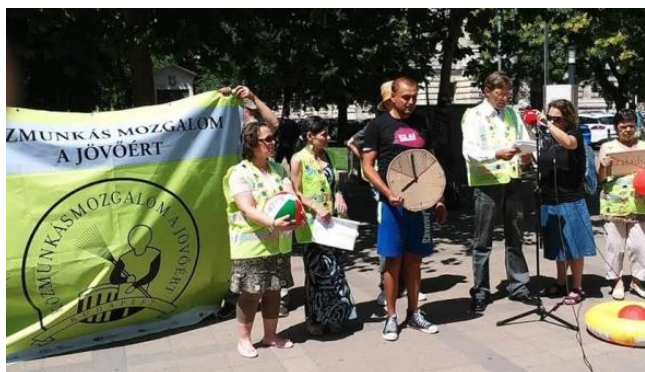
A KMJ akcióban.

„Minden munkahelyen vannak olyanok, akik úgy gondolják, hogy jobb helyzetbe kerülhetnek attól, ha a munkatársaikra terhelő információt adnak a vezetőnek. A közmunkában nem látom, hogy mi lehet ez az előny, talán az, hogy a munkavezető elnézőbb lesz velük, lezserebben vehetik a munkát, de a fizetése senkinek nem lesz több. Amikor beszélgetek valakivel, nem csak arra kell figyelni, hogy a vezető ott van-e, hanem arra is, hogy milyen munkatárs áll éppen a közmunkás mellett. Mint a szocializmusban: megy a megfélemlítés, működik a besúgó rendszer, a belügyminisztériumtól a közmunkásig az egész rendszer a megfélemlítésen alapul.”