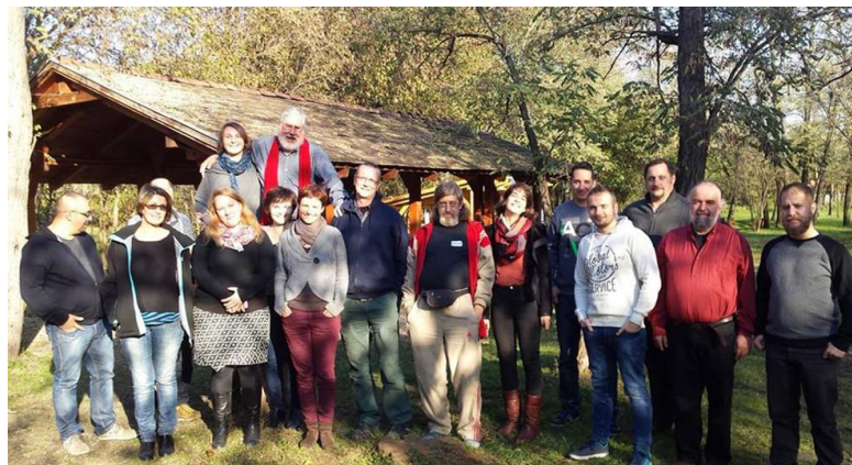
Haladó képzés.

a közösségi alapú szervezőmunka különböző szinteken és volumenekben zajló gyakorlatáról, szereplőről, tematikáiról, módszereiről, különös tekintettel a kisebbségekhez kapcsolódó érdekvédelmi jellegű közösségi munkára. A program további elemeiben amerikai mentorok érkeztek Magyarországra (és három további európai országba), akik több száz hazai kezdeményezéssel kerültek kapcsolatba. A programba öt OSIFE támogatottnak is sikerült bekapcsolódnia, illetve, ahogy fentebb már írtuk, az amerikai közösségszervező mentorok képzési és konzultációs szakmai támogatást nyújtottak közösségszervezőinknek, évente legalább két alkalommal (beszélgetéseket, műhelyeket, képzéseket, előadásokat tartva szerte az országban), ezzel segítve munkájukat.