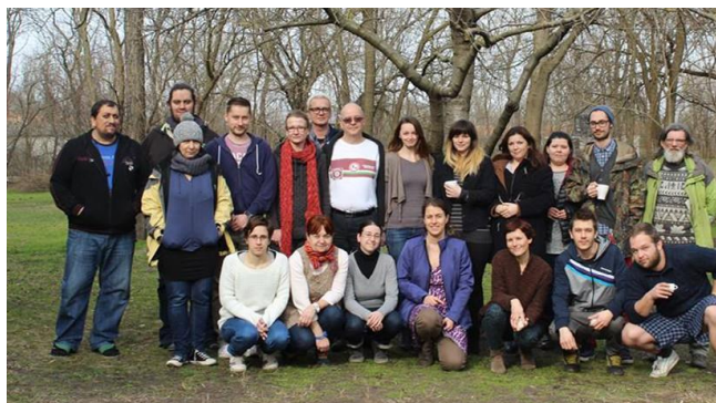
Közösségi vezetőképzés.