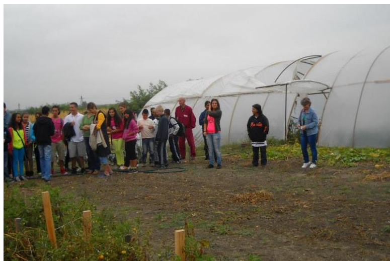
Hejőkeresztúri iskolások Hejőszalontán

Átéltették azt az élményt, hogy a mélyszegénységből jó példát tudnak mutatni az elvégzett feladatokkal a saját gyerekeiknek és azok osztálytársainak egyaránt. A büszkeség kölcsönös volt: a gyerekek jó példát láttak maguk előtt a szüleik munkája kapcsán, a szülők pedig valódi értéket előállítva mutattak utat a gyerekeiknek saját jövőjükhez kapcsolódva.