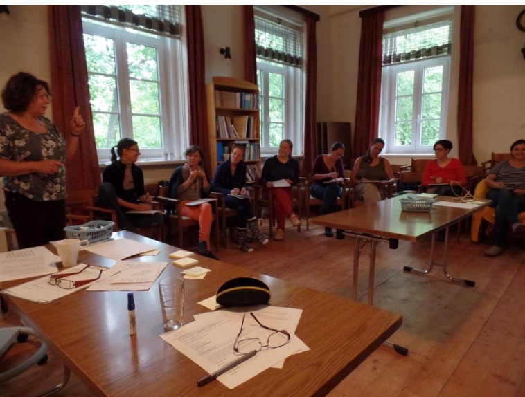
2017 szeptemberében elvonultunk egy hétvégére a kunbábonyi Civil Kollégium szervezetfejlesztő képzésére

Azt is megtudtam, hogy hová fordulhatok ezért.