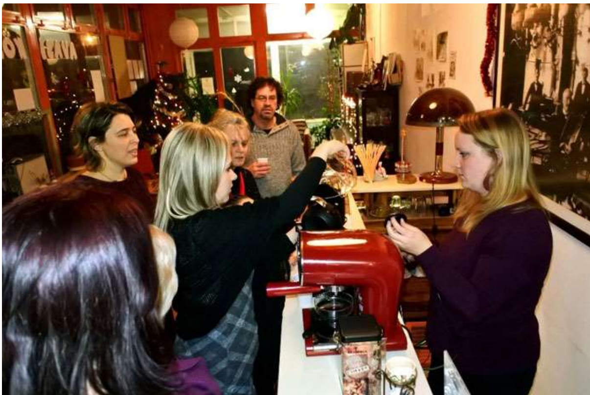
Dialóg karácsony a Közösségi Kávézóban