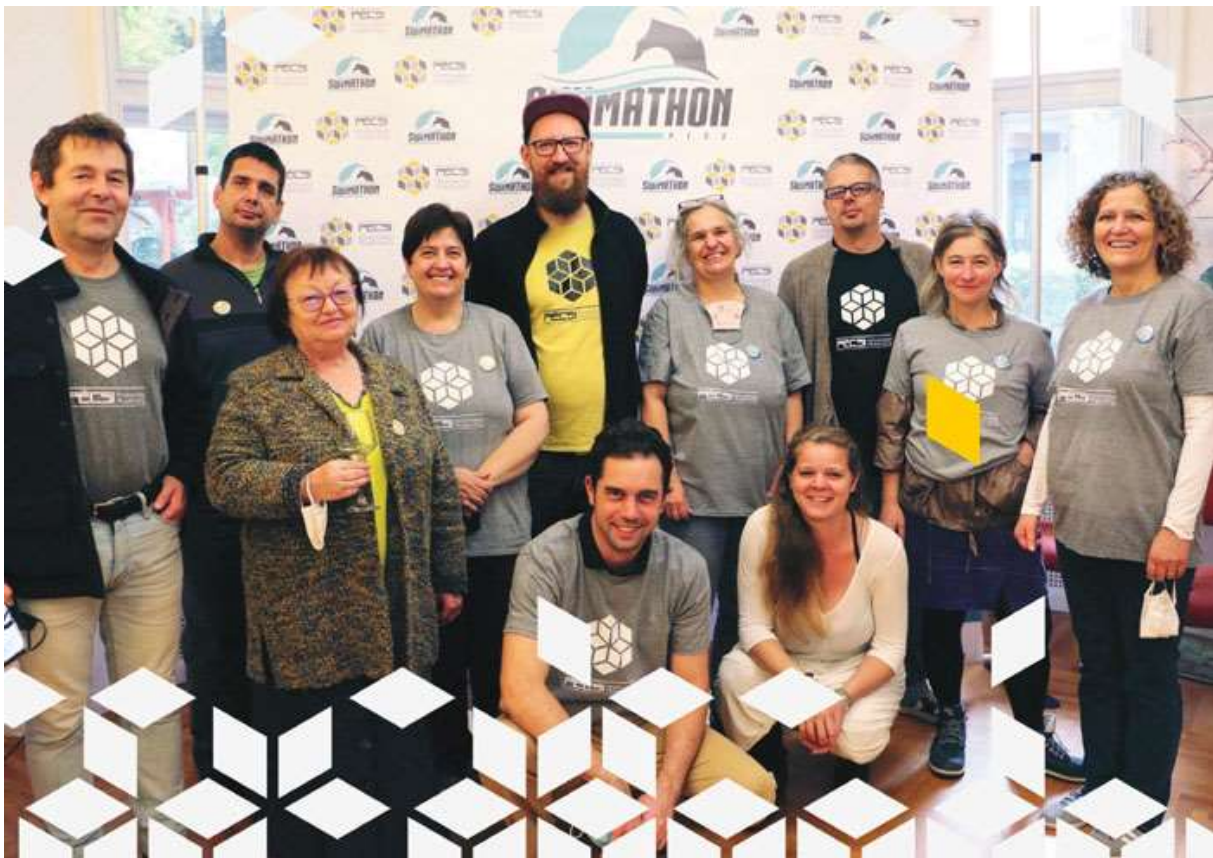
A Pécsi Közösségi Alapítvány tagjai

A Pécsi Közösségi Alapítvány tevékenysége széleskörűen ismert Pécsen és a Pécs-környéki településeken. Helyi közösségi ügyek, társadalmi problémák felkarolásával élen jár a civil közösségek aktivizálásában és támogatásában Baranya megye központjában.