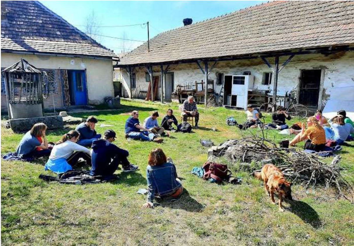
Tervezetés a Tájház udvarán