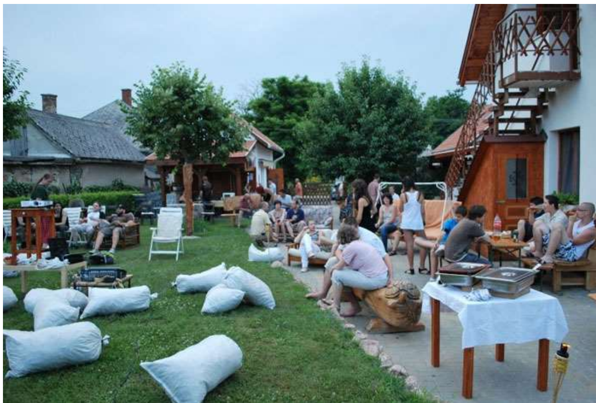
Kertmozi a Mag-házban

Komárom városa kistérségi központ 6 középiskolával, s a környező települések közül a miénk az egyetlen ifjúsági hely. Az állam által fenntartott közösségi helyek nem fiatalbarátok. Ez a gyermekeinket is érintő probléma elegendő ok volt a szülőkkel való kapcsolatteremtésre, a megoldás keresésére pedig az összefogás kínálkozott. Ennek eredményeként született meg az elhatározás: saját közösségi teret kell kialakítani. Vásároltunk egy kicsi épületet nagy telekkel, a házat gyakorlatilag teljesen át kellett alakítani, szinte újat kellett építeni. Egy év alatt, több mint száz önkéntessel mindezt végig is csináltuk.