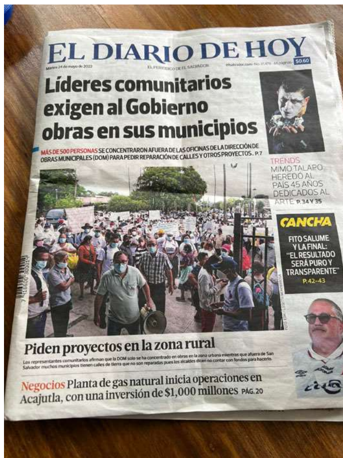
Címlapon a COFOA