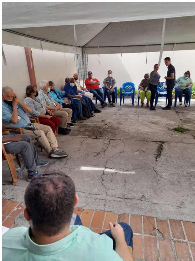
A COFOA központ udvarán

A püspökkel való beszélgetés után a La Paz régió szervezői és csoportvezetői számoltak be eredményeikről: az egyik csoport elérte, hogy hidat építsenek, a másik iskolát építtetett. A képen látható felszólaló a COFOA arca, egy fiatal édesanya, aki a gyermekei számára akar jobb jövőt építeni.