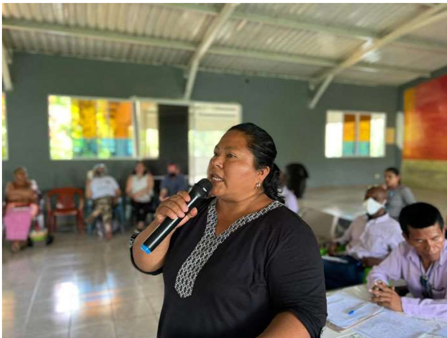
Többségben nők a szervezők

A képzéseken túl, rendszeres terepen való jelenléttel 24 közösségszervező, az őket segítő területi vezetők és a központi iroda munkatársai támogatják munkájukat.