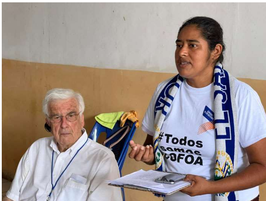
A COFOA egyik arca

A püspökkel való beszélgetés után a La Paz régió szervezői és csoportvezetői számoltak be eredményeikről: az egyik csoport elérte, hogy hidat építsenek, a másik iskolát építtetett. A képen látható felszólaló a COFOA arca, egy fiatal édesanya, aki a gyermekei számára akar jobb jövőt építeni.