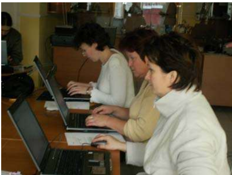
Számítástechnikai képzés

MZs: Azt hiszem, talán ez volt a legérdekesebb része a dolognak, amikor elkészítettük a tananyagokat, akkor persze ebbe bevontunk külső szakértőket, de már abban is voltak helyi emberek, főként tanári végzettségűek. Matematika, angol, magyar – szóval többféle tananyag volt, és akkor kerestünk olyan helyi lakosokat, akik ezeket a tantárgyakat tudnák tanítani a helyi embereknek, tehát egy mérnököt, aki a matematikát, egy nyugdíjas tanítónőt, aki a magyart vállalta vagy valakit aki angolul tud, de nem feltétlenül tanári végzettségű.