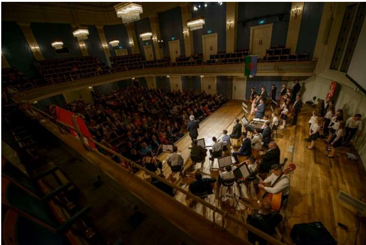
A Máltai Szimfónia a bécsi Wiener Konzerthausban

PF: A települések, ahonnan a gyerekek jönnek – Göncruszka, Észak-Zemplénben van valahol, Nyírmihálydi, mondjuk talán nem olyan távol, Tarnabod, Tarnazsadány – egymástól távol vannak. Hogy sikerül találkozni, hogy tudnak együtt lenni, vagy mindenütt helyi programok zajlanak?