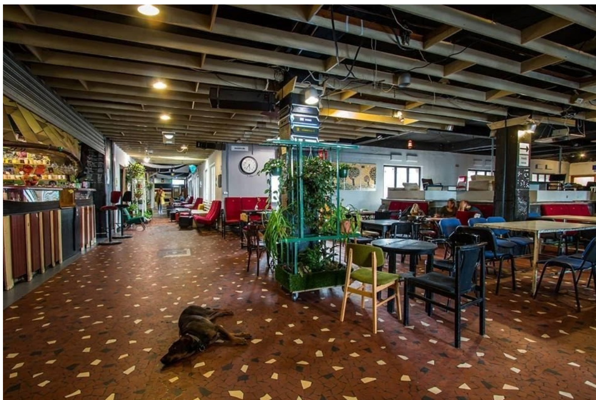
A MŰSZI a Corvin Áruház harmadik emeletén

Talán a romkocsmák voltak az első jól látható jelei annak, hogy egy fiatal generáció üres terek használatbavételével a saját ízlése és igényei szerint akar közösségi és kulturális életet szervezni. Bár e létesítmények elsődlegesen gazdasági szereplőknek tekinthetők, jelentős szerepük volt és van a főváros alternatív kulturális és közösségi életében.