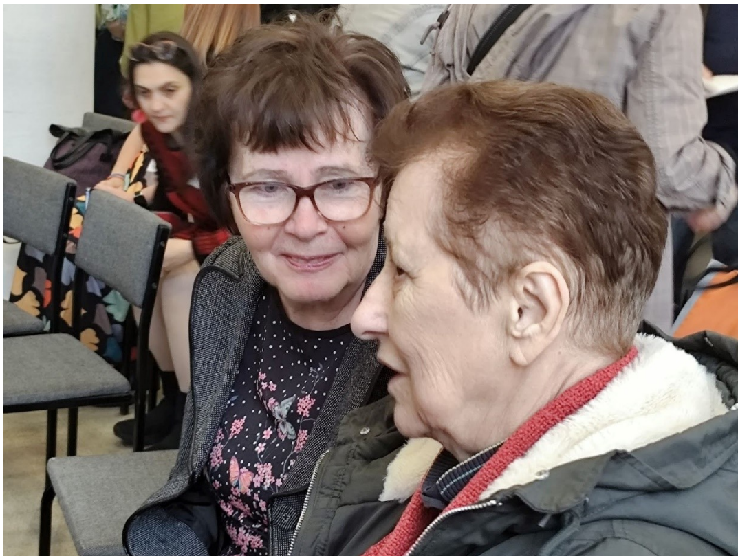
Nagy találkozások és jóízű beszélgetések a szünetben