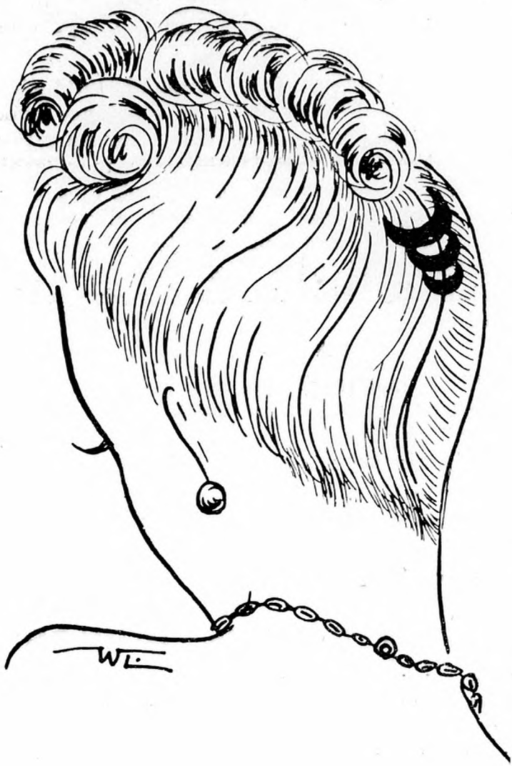
Modern nyári frizurák