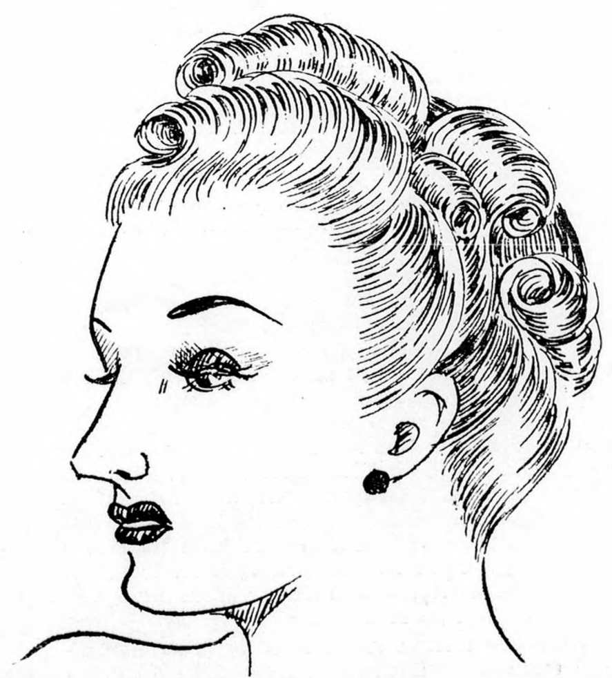
Az Országos Tartósondoláló versenyen készült különleges frizura kreációk