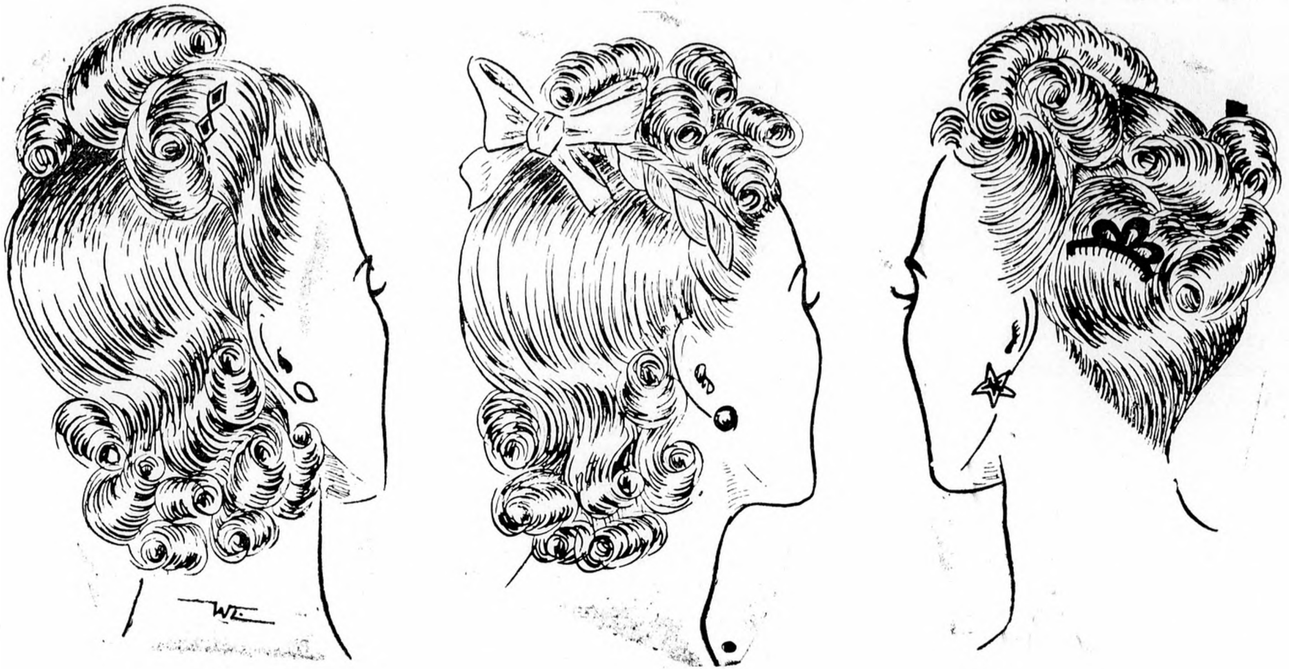
Modern nyári divatfrizurák.

nek és az év utolsó részében a hadigazdálkodásra való áttérés hatásait vizsgálja a hitel és pénzügyek, a gyári és kisipari termelés, a külkereskedelem és a belső áruforgalom, továbbá a közlekedés és az idegenforgalom terén. Külön részt szentel a szociális reformok hatásainak és a szakoktatás terén bekövetkezett fontos fejlődésnek.