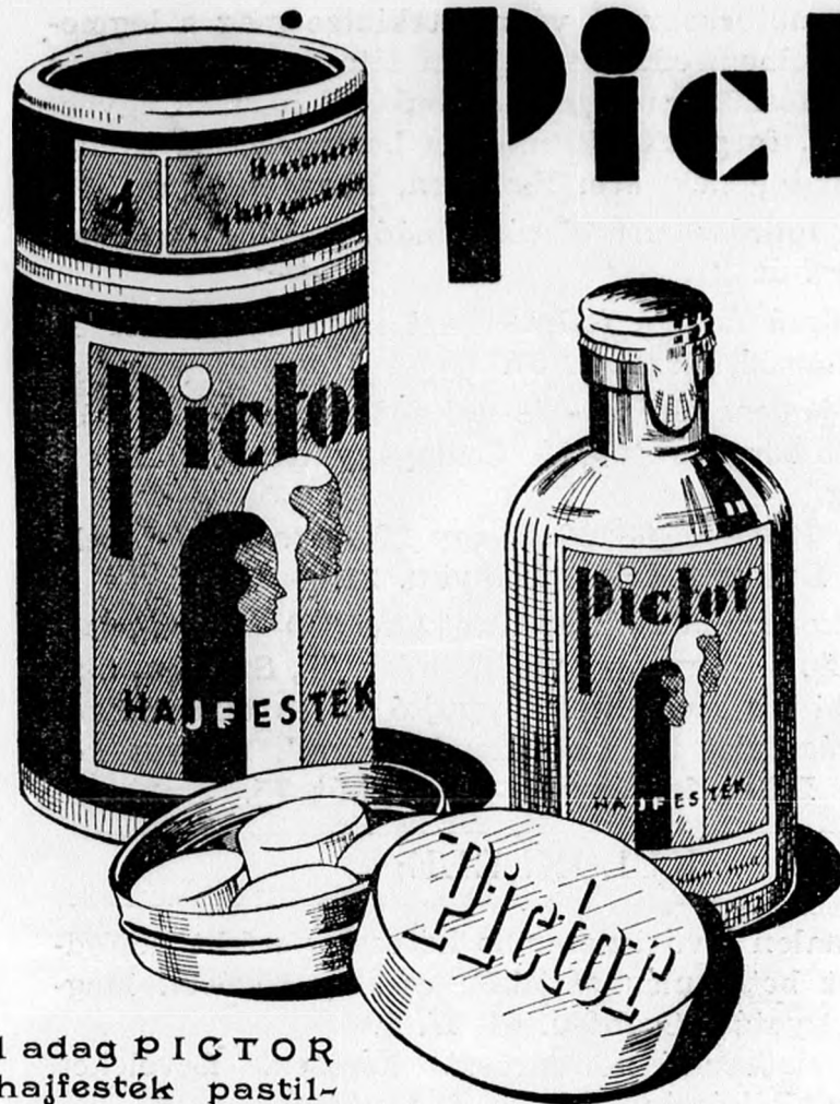
1 adag PICTOR hajfesték pastil- lával P. 2.62.