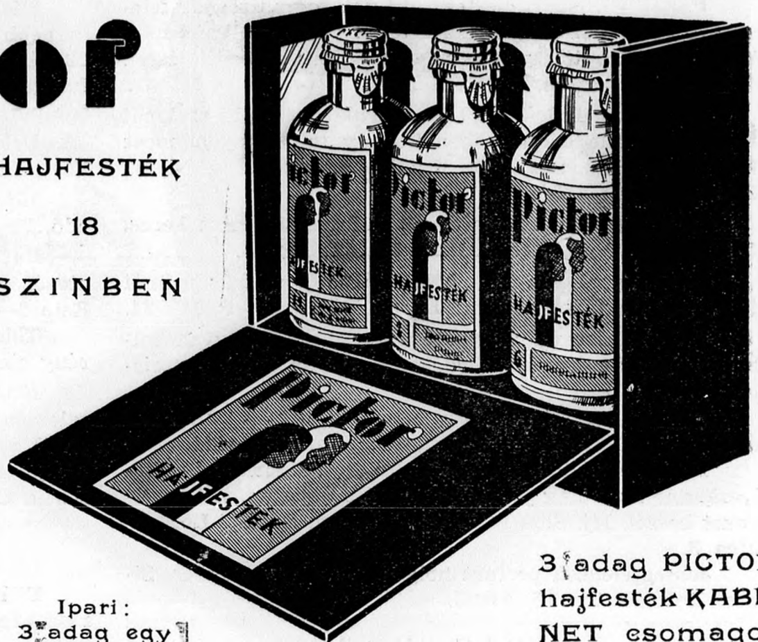
Ipari: 3 adag egy szinben P. 4.20